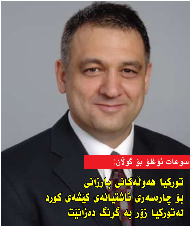
سوعات ئۇغلۇ بۇ گولان: