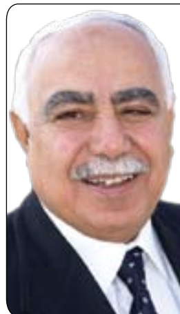
پ. د. نازاد نەقشەبەندى

- دابەش نەكردنى پلەو پايەو سامان بە شىوێهەكى دادپەرەوانەو بە پشتەستىن بە لىتەتووىيى تاكەكان، كە لە لايەك دەبىتە ماىەى هەست بەستەم كردن لاي زۆرىنەى خەلك و لە لايەكى تر، بە پشت بەستىن بە پرنسىيى، «بۆ ئەوان رەوايە بىنە خاوەن ماف و جياوكىك كە شاىستەى نىن بۆ بۆ من نا» داواى داواكارى ناپەرەوا دەكرىت .