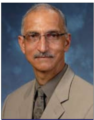
فرانك ئەنيجيارىكو بۇ گولان:

و ههروهه له دهروهوي ولا تيشه وه له پيناو وه ديھناني بهر پيدان، به لام پيوسته وه بهرھينان له نينگه به كي تهنروس ت ييت كه تييدا حوكمرا نييه كي باش ههيت بهوشيو به يه كه هاندهر ههيت بۇ وه بهرھينه راني كه رتي تاييهت بۇ مه به ستي كار كردن و فراهه مكردي ههلي كار كه ياريدده ريت بۇ بهرھينه وه جووني ولا ت، به لام نه گه هات و بهرھينه ره كان هه لسستان به پيداني به رتيل له پرؤسه كان تهندر و له پيناو بردنهوي گريه سه سته كان، نهوكات ده يته هوي سه ره لداني گندهلي و دوورخستنهوي نهو كؤمپانيا وه بهرھينه ره راستگو و باشانه ي كه مه به ستيان هه به خزمهت بهر پيداني ولا ت بگه به نن، ههريويه حوكمرا نيي باش پيوسته بۇ بهر پيداني ولا ت و مه رج نييه هه موو جارنك هه بووني وه بهرھينه ر يياني له ولا ت واتاي ته شه نه بووني گندهلي بگه به نييت. ههريويه گرنگ ترين شت نهويه هه ولدان ههيت له هه موو كاروباره كان كه رته حوكميه كاندا بۇ به ديكيؤ ميئت كردني ئيجرائاته كان له گهل بلاءو كردنهوي زانيار به كان له وروهوه له بهرتهوي گندهلي لهو شوئانه دا ته شه نه دهكات كه تييدا ئيجرائاته كان حكومت ته مو مژاويه و