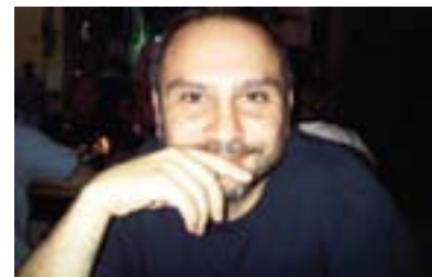
ئوموت ئوزكيريملی بو گولان:

هه ر له م چوارچيو يه دا و وه كه مه زنده يه كه يو رووخاني رژيمي ته سه د و نه لته رناتيشي رژيمه كې ته سه د و دؤخې پيگه ته جياوازه كاني سويا كه كورد يه كيكه له پيگه ته كاني سويا تا ئيستا مافي هاوولاتي بوونيشي نيبه، پرؤ فيسؤر عيماده دين له دريژهي ليدوانه كه يدا بو گولان گوتي: (پرسی به ديلي به شار ته سه د پرسيكه لايه ننگه ليكي جوړاو جوړي