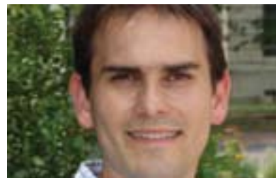
ته ليكسه ندر تؤميسن بو گولان:

تؤميسنيش به هاوشيوه ي پرؤ فيسؤر عيماده دين شه پرسه به دوور ده زانيت، له م باره وه له دريژهي ليدوانه كه يدا بو گولان، پرؤ فيسؤر تؤميسن وتي: (تا شه ساته باوهرنا كه م هيچ ولاتيك به يي ره زامه نديي ته نجومه ني ئاسايش ده ستيوهرداني سه ربازي شه نجامدات، له و بروايه دانيم ولاتانيك وه كو به ريتانيا يان فه رنسا به ته نيا بتوانن ده ستيوهردان بكه ن، له به رنه وه ي پيوستيان به هاووكاري شه مريكا ده بيت، هاوكات هه ست به هيچ ئيراده يه كي سياسي له لايه ن شه مريكا وه ناكم له رووي ده ستيوهرداني سه ربازي به يي ره زامه ندي و هاوويه يمانتيي ته نجومه ني ئاسايش، به لام له لايه نيكي ديكه وه شه گه ر هات و بارودو خه كه رووي له خراپتر كرد و نه گه ريش