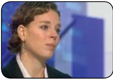
ميگا گرین بۇ گولان: