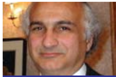
عیمادەھین ئەحمەد بۇ گولان:

راپۆرتەكان فشار بخەنە سەر روسیا بۇئەۋى پاشەكشە لەھەلۆستەكانى بكات و رېنگە بدات بەدەستىۋوردان لەسوریا ھاوشیۋە لەگەل كەیسەكەى لیبیا كاتىك رەزامەندبوو لەسەر دەستىۋوردانى كۆمەلگەى نیۋدەۋەلتى لەلیبیا، بۇیە لەۋانەبە ئەۋكات دەستىۋوردان ئەنجامبدرت. سەبارەت بەبیدەنگى تورکیا، من پئومايە ئیسو لەم مەسەلەبەدا باش ئاگادارنېن و تورکیا بیئەنگ نەبوۋە، چونكە رۆژانە بەدواداچوونى ھەلۆستەكانى تورکیا دەكەم، تورکیا بیئەنگ نییە، بەلكو تاراددەبەكى زۆرىش باسى سوریا دەكات، تاكە شت كە تاكو ئیستا تورکیا نەبىكردوۋە دەستىۋوردانى سەربازىبە، زۆربەى ھاۋولاتیان لەزمنیشیان كەسانىك لەپارتى دەسەلاتدار كۆن لەسەر دەستىۋوردانى خیرا،