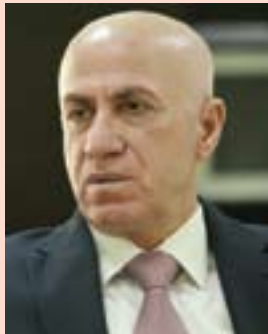
مه محمد محمه د ئه ندانی مه کته بی سیاسی پارتی دیموکراتی کوردستان

گولان له ریزه بندی ئه وه ویاته کان و پیداو یستی قوناغه کاندایا