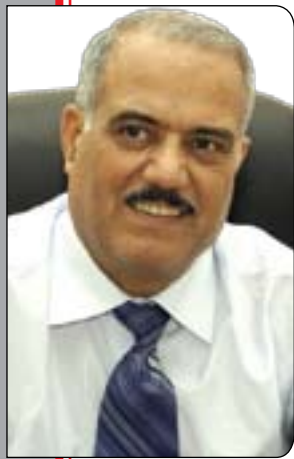
د: خه لیل ئیسماعیل محمه د

له کاتیکدا نه و شه بۆ لانه به شیوه به ک له شیوه کان توانیان تیکه ل به دانیشته وانی نا وه ندو باشو ور بین، نه وش به هۆی ته ختایی زه وی