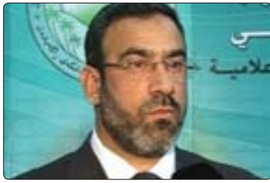
وھلید عەبۇد بۆ گولان: