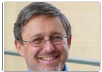
ئايڧۇر شاپىرۇ بۇ گولان:

بۇ گولان بەمجۆرە راي خۇي دەپرى و وتى: (ميديا پالپشتى لەحكومت ناكات، بەلكو ميديا لەكۆمەلگەي ديموكراسيدا پالپشتى لەھاووللاتيان دەكات لەرئىگەي ئاگاداركردەھەدى ھاووللاتيان بۇئەھەدى بزانت چى رۇودەدات و بەناگابن لەكىشە و رۇوداھەكان، پىموايە ئەركى سەرەككىي ميديا برىتتييە لەئاگاداركردەھەدى ھاووللاتيان و برپارەكەيش لەدەستى ھاووللاتيان دەيىت لەرووي پەسەندكردىن يان رەتكردەھەدى كاركردىن لەگەل حكومت، يان رەخنە گرتن لەحكومت ياخود ستايشكردىن، يانىش لەرووي رىفۇرمكردىن حكومت، رۇژنامەگەرى گرنىگە لەرووي ئاگاداركردەھەدى ھاووللاتيان بۇئەھەدى ھاووللاتيان بتوانن حكومت پىكىيىن، رۇژنامەگەرى حكومت پىكناھىيىتت، بەلكو رۇژنامەگەرى خالى ميانرۇيە لەنيوان حكومت و ھاووللاتيان بۇئەھەدى ھاووللاتيان بەئاگاينىتت لەبارەي كار و رەفتارەكانى حكومت. ھەروھە بۇئەھەدى ھاووللاتيان بتوانن بەباشترىن شىپو برپارىدەن لەسەر چۆنييەتى مامەلە و كاركردىن لەگەل حكومت، ھەربۇيە ئەگەر لەنيوان ھاووللاتى و ميديا متمانە نەبوو، ئەوكات زۇر زەھمەتە ميديا بتوانىت يارمەتتى ھاووللاتيان بەدات، چەندىن نمونە ھەن كە تيايدا ميديا بەپىنى پۈئەست مومارەسەي ئەركەكانى ناكات،