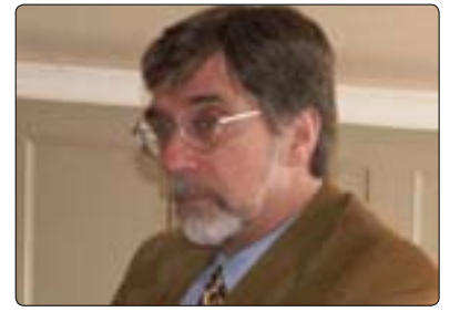
لى باركەر بۇ گولان:

بوونىكى ئەوتۇي نەيىت، ئەم دياردەيە ئەگەر دياردەيەكى ديارى سەرچەم ولاتانى تازە يىگەيشتوويىت، ئەوا لەولاتى ئىمەش ئەم دياردەيە بوونى ھەيە، چۆن بۇشايبەك لەنيوان دەسەلات و خەلك بوونى ھەيە، بەھەمان شىپو بۇشايبەكيش لەنيوان ماس ميديا و خەلكيش بوونى ھەيە و، بۇيە ئەم لايەنە ئەگەر بۇ ولاتانى پيشكەوتتوي رۇژئاوا ھاندەريك يىت بۇئەھەدى ھاووللاتى بەدواي چەند سەرچاويەكى ميديا بگەرپت بۇئەھەدى خۇي بربار لەسەر راستيەكان بەدات، ئەوا بۇ ولاتانى تازە يىگەيشتووي دەيىتە ھۇكارى ئەھەدى كە خەلك لەميديا دوور بەكەوتتەھە، دووركەوتتەھەدى خەلك لەھۇيەكانى ميدياش زيانىكى گەورە بەر پرۇسە ديموكراتىيەكە دەكەوتت، سەبارەت بەم پۈئەندىيە پرسبارمان لەپرۇفيسۇر چارلس داڧيس ئوستادى رۇژنامەوانى لەزانكۆي ميزورى كرد و لەلئيدوانىكى تايبەتدا بۇ گولان سەبارەت بەم پۈئەندىيە بەمجۆرە ھاتە ناخاوتن: ((بەپراي) من چەند ھەنگاويك ھەن كە پۈئەستە ميديا پيادەيان بكات بۇئەھەدى خەلكى متمانەي پىچ بكەن، ھەلبەتتە ھۇكارەكانى پىشت نامتمانەيى ھاووللاتيان لەبەرامبەر ميديا زياتر بۇ ناوەرپۇكى ھەوال و زانباريەكان دەگەرپتتەھە نەك بەھۇي شىوازي ئەدای ميديا، بەلام ئەگەر بىيەنە سەر باسى شىوازي ئەدای ميديا ئەھە بەپراي من پۈئەستە لەسەر رۇژنامەنوسان تاناستىكى بەر فراوان