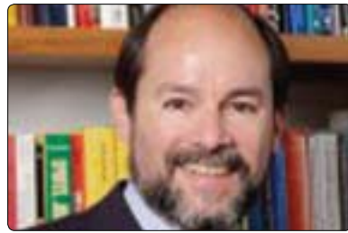
رۆبەرت لۆرانس بۇ گولان:

ئاکامى دەستیۆەردانى سەربازى لەسوربا تەواو جیاواز دەبیّت لەدەستیۆەردانى سەربازى یوگسلافیا و لیبیا