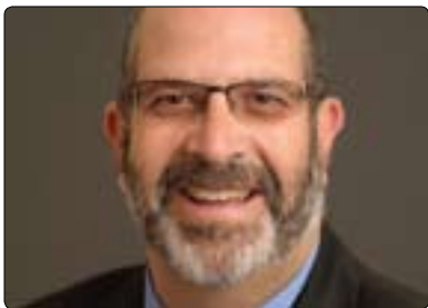
چارلس داقيس بۇ گولان:

ئاسايى و دەتوانىن بەسەرەخۆيى و ئازادانە باسى رۇوداو و بەسەرھاتەكان بىكەين و بلاويان بىكەينەو بەيى ئەوئى كەس رېگىيمان لى بىكات و ئەگەرەش رېگىرى ھەبو دەتوانىن برۇينە سەر ئەنتەرنىت و ئەوئى بمانەوئى باسى بىكەين، بەلام پىويستە رۇژنامەنووس جەخت بىكاتەو لەسەر حەقىقەتى بابەتەكان پىش بلاوكردەنەو، لەلايەتتىكى دىكەو و لەبەرئەوئى چاودېرى لەسەر ئەنتەرنىت نىيە، كە ئەمەيش خۇي لەخۇيدا شىتتىكى باشە، كەسى رۇژنامەنووس دەتوانىت پىداچونەوئى ھەوال و بابەتەكانى ئەنتەرنىت بىكات و ئەو ئەركى رۇژنامەنووسە بۇ جەختكردەنەو لەسەر راستىيەكان و كارىكات بۇ دىلنابوون و جەختكردەنەوئى زانىيارىيە دروستەكان لەگەل پىشتراستىكردەنەوئى زانىيارىيە ھەلەكان، ئەمەيش ئەركى رۇژنامەنووسە لەم جىھانە دلگىرەي كە ئەمىرۇ تىايدا دەئىن).