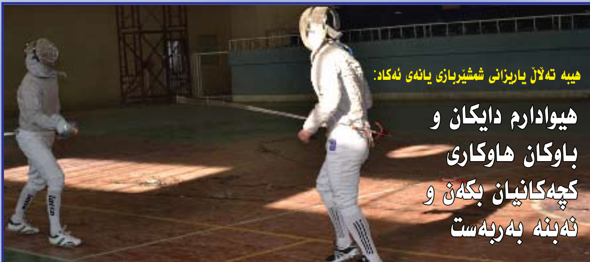
ھېبە تەللاڭ ياريزانى شمشيربازى يانەى ئەكاد: