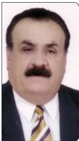
خه ليل يابه كريم