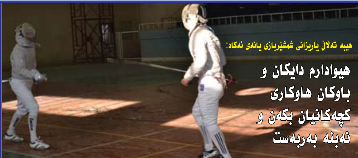
ہیبہ تہلال یاریزانی شمشیربازی یانہی ئەکاد: