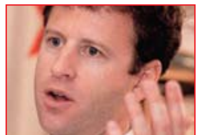
مايكل ئۇھالون بۇ گولان:

پروڤىسۆر ستىڤن زۇنرس ئوستادى پىوھندىيە نىوئەولەتتەكان لەزانكۆى سانفرانسىسكو و شروڤەوانى نىوئەولەتى لەسەر رۇژھەلاتى ناوېراستىش سەبارەت بەبايەخ و گرنگى سەردانەكەى سەرۆكى ھەرىمى كوردستان بۇ ئەمريكا لەيدوانىكى تايىبەتدا بەگولانى راگەياند: (ئەم سەردانەى سەرۆك بارزانى نىشانەى ئەوېبە كە ئىدارەى «ئوباما» گەبىشتووتە ئەو قەناعەتەى كە ناكرى