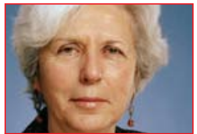
مارينا ئۇتاوا بۇ گولان:

گەلى كوردستان بكاتەوہ، سەبارەت بەم لايەنە پسپۆران پىيانوايە ئەم كىشانەى عيراق تەوھرى سەرەكى كۆبوونەوہەكانى سەرۆك بارزانى دەبن لەگەل سەرۆك ئوباما، لەمبارەوہو لەدرېژى لىدوانەكەيدا بۇ گولان پروڤىسۆر دەبىشيد فلىپس وتى: (كوردەكانى عيراق باشتىن دۆست و ھاوپەيمانى ئەمريكا لەعيراقدا، سەنگى كورد لەبىرناكرىت و ھاوكات ئەمريكا بەرژوھەندىيەكانى عيراقىش لەبەرچاروئەگرىت بۇ ئەوھى ئازادى و سەقامگىرى لەولائەتەكە بچەسپىت. ھەررەھا ھەرىمى كوردستان خاوەن سىياسەتى فەرمى و سەربەخۆبە، كورد دەستورى عيراقى وھكو ستراتىجىيەتتىكى يەكلاكرەوہ داناوہ بۇ چارەسەركدنى كىشە و ناكۆكيەكانى لەعيراقدا، ئەو دەستورە تاكو ئەمرويش بناغەبەكە بۇ چارەسەركدنى كىشەكان، بۇيە پىويستە لەسەر ھەموو لايەنەكانى «عيراق» پىكەوہ كاربكنە لەسەر بنەماى پاپەندىبوون بەدەستور و لەرېگەى پالېشتى و ھانسان لەلايەن ويلايەتە يەكگرتووەكانى ئەمريكا-وہ پىناو بەرەوپىششەوہچوونى ولات لەسەر بنەماى لىكتىگەبىشتن. ھەر بۇيە كەس ئەوہ پەسەند ناكات كە عيراق رېگەى دىكە بگرېتتەبەر بۇ چارەسەركدنى كىشەكانى، دەستور برىتتەيە لەيەكلاكرەوہبەكى پەسەندكراو لەلايەن ھەمووانەوہ بۇ ھەنگاو ھەلگرتن بەرەو پىشەوہ، من لەنىگەرانيبەكانتاتان تىدەگەم