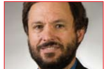
ستيفن زونزىس بۇ گولان:

سەبارەت بەمەترسى دووبارە ھەنگاو ھەلگرتنى سەرۆك وەزىرانى عىراق بۇ تاكرمى و ھەولدان بۇ راستكردەو ەى پرو ەسى سياسىي لەعىراقدا، دەفید فلىپس پىي وتىن: (ھەلبەتە ئىو ە ھەقى خۆتانە ھەست بەناتومىدى بكن، لەبەر ئەو ەى سەرۆك وەزىرانى عىراقىي مالىكى ئامادەباشى تىدانىيە بۇ جىبەجىكردى رىككەوتنەكان، كورد بەدرىژاىي دەيان سالى و چەندىن ئەو ە مەينەتتىي چەشتو ە لەپىناو ھىنانەدىي ئامانجە نەتەو ەيەكانىيان، ئەمرو یش ئەو ە ئامانجانە لەدەستور-دا ئامازىيان پىكراو، ئە گەر بىت و عىراق پاپەندىت بەسەرورەى ياسا، ئەوكات بەندەكانى دەستور جىبەجى دەكات،