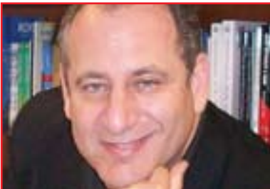
داڤىد فلىپس بۇ گولان:

كوردستان بەردەوام بىت ئەو ھىچ لايەك لىي قبول ناكات و لەمبارو ەوتى: (بەراى من ئەمريكا ئەو ەى لەتوانايدا ھەبىت دەيكات بۇ رىگىرى لەجىابوونە ەى كوردستان لەعراق، ئە گەر ھات و ئەمەش روويدا ئەو پىموايە لەمەودايەكى دوردا زۇربەى ولاتان بەويلايەتە يەگرتو ەكانى ئەمريكا-شەو ە واقعەكە ھەرسدەكەن، بەلام پىموايە ھەول و كۆشى دىيلۇماسىي زۇر دەخريتە گەر لەپىناو قەناعەتپىكردى كورد بۇئەوى جىبانەنەو لە عىراق، بۇيە من پىموايە لەم سەردانەى سەرۆك بارزانى بۇ واشنتون سەرۆك ئۇباما ھەولدەدات كە قەناعەت بە بارزانى بكات برپارى سەربەخۇبى نەدات و گوشارىش دەخاتە سەر مالىكى بۇ ئەو ەى پابەند بىت بەدەستورەو ە).