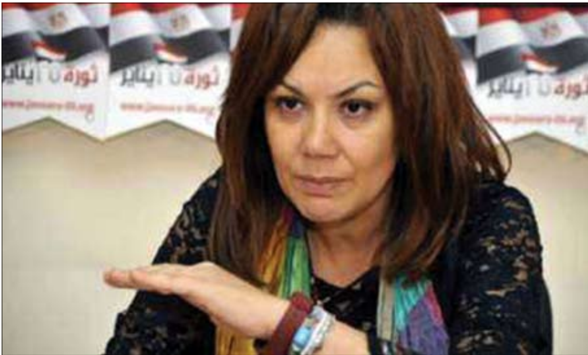
پالېوراو بۇ سەرۋاكيەتى ميسر (بوسەينە كاملى) راگەياندىكار بۇ گولان: