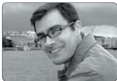
جۆن تۆرى بۆ گولان:

لادانىك يان پىشلىكردنى ئەم دەستورە دەبىتە ھۆكارى ئەوئەى لەعىراقدا شەرى ناوخۆ بەرپا بىت، يان عىراق لەبەريەك ھەلبەشیت، سەبارەت بەم لايەنە پرسىارمان لەپروفىسۆر دىنس چارلس سمىس ئوستادى زانستى سىياسەت لەزانكۆى ئىندىيانا كورد لەلیدوانىكى تايبەتدا بەمجۆرە وەلامى گولانى دايەو و وتى: (چارەسەر کردنى كىشەكان بەئاشتى بەھۆى پابەندبوون بە پرانسیپەكان و دادپەرورەى دیتەدى، بەھۆى چارەسەرکردنى كىشەكانى نيوان