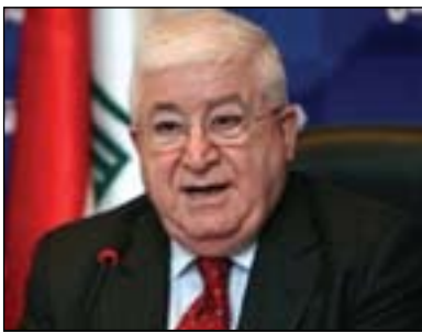
فوناد مەعسوم بۇ گولان: