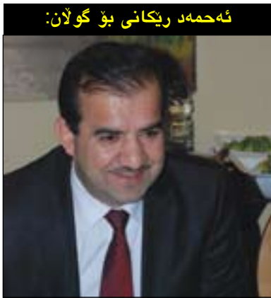
شه حمه د ریکانی بۆ گولان:

سه باره ت به و سستی بوون و لاوازیه ی که رووبه رووی کهرتی بازرگانگی و ئابووری بۆته وه شه حمه د ریکانی سه ره وکی یه کیتی