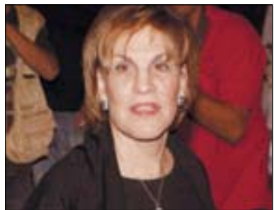
پ. گالیبارناتان بۆ گولان:

لەلایەکەووە ھەلۆدەدات بۆ بەرزراگرتنى دیموکراسییەت و مافەکانى مرۆف، لەلایەکی دیکەووە پێمۆایە سەقامگیری لەسەرۆوى ھەموویانەووە گرنگترە، بۆنموونە ئەگەر سەیریکی بارودۆخەکانى ئەمرۆى میسر بکەن، گەنجى لیبرال بوون کە دەستیان بە جموجۆل و بزاونە کرد بەلام لەئاکامدا ئەنجامەکانیان لەدەستداو کەوتە ژێر کۆنترۆلى ئیخوانى موسلمین و ئەو جۆرە کەسانە لەبەرئەوێ زۆرینى جەماوەر ھەست و سۆزیان بۆ ئیخوان ھەبوو و ئەو بوو لەئاکامدا بە رینگەچاری دیموکراسى ھەلپژێردان، ھەربۆیە پێمۆایە