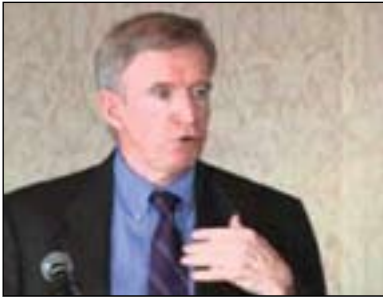
تۆماس كسىنى بۇ گولان:

دەكەن، بەلكو ئوبالەكە دەكەوتتە سەر ئەو كەسانەى رینگە بەو دەستپوهردانانە دەدەن. سەبارەت بە ئەمەرىكاش مەن پىمواپە ئەمەرىكا بەهیزى نەرم مامەلە لە گەل بارودۇخى عىراق دەكات، ئەمەرىكا چەندەها دۇستيان لە عىراقدا ھەيە، ھەر ھەھە سەرچاوەپەكى زۆريان بە گەر خەستتووە تىیدا، لە لایەكى دىكە ئەمەرىكا لە سەر ئاستى ئىقلىمىش زۆر دەستپوهرىشتووە، كە پىوھەندىپەكى زۆر باشى لە گەل نەزىكەى ھەموو ولاتە دراوسىكاندا ھەيە، جگە لە ئىران و لە ئىستاندا سوریا. دەكرىت ئەمە بە كاربەھىزىت بۆ كارىگەرەبوون