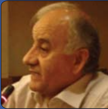
پرۇفېسسور جەمال رەسول*

ئابو كە لە پلاتفۆرمى پىداويستى داتا و زانباربەكانەو كە لەم زەمانەدا بنەماى پىشكەوتنەكانە، كۆمەلگا و بەشەكانى كەرتى تايبەت و گىشتى و زانباربەكانە ناوئەو دەروەى كوردستان لىك نىك بىنەو. ھىندى پى نەچسو بە فەرمانى سەرۆك وەزىران لەسەر پرۆژە كە دەستبەكاربووم و دواى چەند مانگىك لە جىبەجى كرىنىدا ھەنگاوى پىرۆژى نران كە لە ھەرئىمدا دەنگى داىوئەو ھەر بە دەركەوتنى ئەو ئەنجامانەش، زىاد خاوندارىتى پەيدا بوون بۆى و بوو گرى كۆپرو پرۆژەكە بەلادا ھات. دىاردەكان واى نىشان دەدەن كە كاپىنەى داھاتوو نىكبوونەو لە كۆمەلگا و گۆيىستى خواستەكانىان يەكلىك لە پىناسە پىرۆژەكانى دەبىت، بەوئەدا كە پىش دەستبەكار بوونى، رېژدار نىچىروان بارزانى دەروازەى داىلۇگ و پىشنىار و رەخنەكانى بۆ گىشت كۆمەلگاى كوردستانى بەرىن و پاش سنوورەكەشى يەكلاردۆتەو. ئەم ھەنگاوش ئەگەر بە ئاستى دەلەمەندى خۆى بەگەر بىخىت، دەكرىت بىتتە بنەماى پلاتفۆرمىك كە لىوئەى ھەرئەمە نازدارەكەمان لە سەروربىبەكانى كۆمەلگاە نىك بىتتەو.