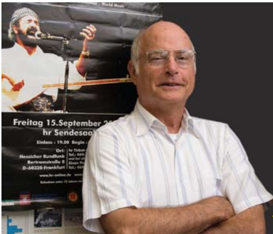
پروفیسور مایکل گھنتەر تایبەت بۇ گولانی نووسیووه

هەریمی کوردستان بتوانیت بەردەوام بێت. بەو پێیە، یە کەم هەنگاو بۆ بەدەستەینانی ئامانجی سەرەخۆبوونی کوردەکان، کە پێدەجیت ئامانجیکی مەحالی بێت، ئەوێهە کوردەکانی عێراق هەموو هەولێکی خۆیان بخەنە گەر بۆ ئەوێ عێراقیکی فیدرال و دیموکراسی بێتەدی. ئەگەر سەلمینرا هینانەدی عێراقیکی لەم چەشنە مەحالی، ئەوا ئۆبالی شکستە کە ناکەوێتەستۆی کوردەکان و ئەو کاتە وا دەرەکەوێت کە مافی خۆیانە- بە پاساوی پاراستنی سەقامگیری- هەنگاو بەرەو سەرەخۆبویی بێنن، کە ئەمە لەبەر ژۆهەندی ئەمەریکا، تورکیا و دەولەتە دراوسێکانی دیکەش دەیت. لەو کاتەدا، دەیت کوردی عێراق قەناعەت بەم دەولەتانە بەین کە لەبەرەرامەر پشٹیوانیان بۆ سەرەخۆبوونیان، هەناستن بە هاندان و خولقاندنی یاخیبوون لە نێو کوردەکانی ولاتانی دراوسێدا، نە بە راستەوخۆ نە بە ناراستەوخۆ. زەمانەتکردنی سەرەخۆبوونی کوردەکانی عێراق لەلایەن ئەم دەولەتانەو دەیتە پالئەریکی بەهێز بۆ کوردەکانی عێراق بۆ ئەوێ لەو کاتەدا ئەم ولاتانی رازی بکەن. لەوێ زیاتر، پێویستە کوردەکانی عێراق بە شیۆهەیک هەنگاو هەلبگرن کە دراوسێکانیان، لە نێویاندا عەرەبەکانی عێراق بە رەوای بزانی بۆیان. رەنگە ئەمە سازشکردن لەخۆبگریت لەبارە خواستی کورد بۆ کۆتەرۆلکردنی تەواوی شاری بە