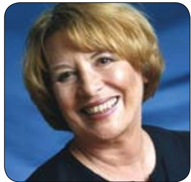
ئانى پۇمىرۇى بۇ گولان:

✽ راپەرىن پىمان دەلئىت، من بەشىكەم بەرھەمى خۇنى كچان و ژنانى ئەم ۋلاتە، بۇيە ئازادىيەكەشم بەشىكى مولكى ژنان و كچانە و كەس ئەم مافەى نىيە لئىان زەوت بىكات يان ئازادىيان پىچ بەدات، چۈنكە ئەوانىش بەخۇنى خۇيان ئەم ئازادىيەيان نەخشانەۋە و چەندىن شەھىد و بىرىندارىيان بۇ سەرخستنى راپەرىن پىشكەش كىردوۋە، بۇيە پىۋىستە لەقۇناخى دۋاي راپەرىن كچان و ژنانى ئەم ۋلاتە ئازاد بن، كەۋاتە پىۋىستە رۇئىمە مافى ژنان و كچاننى ئەم ۋلاتە بگىرئىت و دەبىت بەھىندەى قەۋارەى خۇيان(كە ھەندىك دەلئىن لەنىۋەش زىاترن) دەبىت بوارىيان بۇ بىرئىتەۋە بەشدار بن، دەبىت كچان و ژنانى ئەم ۋلاتە ئەو پىرسىيارە رۋوبەرووى كور و پىاۋانى ئەم كۆمەلگەبە بىكەنەۋە، بۇچى كاتىك ژنان و كچان ھاتنە رىزى پىاۋەكان و لەپىناۋى ئەم