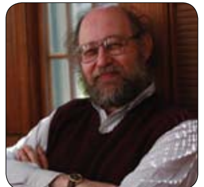
دانىال گاربەر بۇ گولان:

دەپتەرت بىلەت لەو واقعەى ئەو كاتەى تىپدا دەزى توناي ژيان نەماو، يان ژيان ھېچ مانايەكى نىيە، لەمباروھە وتى: (ھۆكارى ھەلگىرسانى شۆرش بۇ ئەو دەگەرپتەوھە كە خەلك دەگەنە ئەو باوھەرى كە چىتر ناتانن لەو واقعەدا درىژە بەژيان بەدەن و چىتر ناتانن تەحەمولى ئەو واقعە بكەن كە كەرامەت و ژيانى تىكداو، بۆيە لەم پروانگىيەمەو بەناخەى ژىرخانى سەرکەتو بۇ شۆرش و راپەرپىن، برىتییە لەيەكگرتن لەسەر بنەماى خۇشويستنى يەكترى نەك لەسەر پرقەھلگرتن لەدوژمنە سىياسىيەكەيان. ھەررەھا بەدیوھەكى دىكەدا ھاوکارى و پشٹیوانىكردنى يەكترییە بۇ بونىداننەوھى قۇناخى دواى راپەرپىن، ھەر بۆنمونه شۆرش كۆمارى نازادى ئەمىركاى بونىاد ناوھ كە زۇرجار ئىمە فەرمۇشى دەكەين و زۇرجار ئەوھى ئەمىركىيەكان لەبىرى دەكەن ئەوھى ئەم ولاتە لەسەر بنەماى شۆرش دروست بوو. ئەو شۆرشەى لەسەر بنەماى خواستى رزگاربوون لەئىمپراتۆرىيەتى بەرىتانى بەرپاكارا، بۆئەوھى خەلكى بتوان برپار لەچارەنوسى خۇيان بەدەن. كەواتە مەن بىر لەشۆرشى ئەمىركىكى دەكەمەوھ. لەگەرمەى شۆرشەكەدا خەلكى پەرۇشى يەكتر بوون و بايەخيان بەيەكتر دەدا. ئەمەش تا دوا ئەندازە زەحمەتە، لەبەر ئەوھى