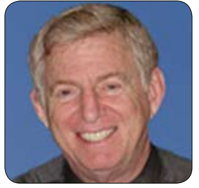
ستوارت كۆھن بۇ گولان:

بەگولانى راگەياندا: (زۆر قورسە بتوانىن بەشپوھىەكى گىشتى وەلامى ئەم پرسىارە بەدەنەوھە، لەبەر ئەوھى چەندەھا راپەرپىن و شۆرش بەھۆكارى جىاواز بەرپاكارون، نمونە بەرچاوەكان برىتىن لەشەرى ناوھوى ئىنگلىز، شۆرشى ئەمىركا و شۆرشى فەرەنسا و شۆرشى روسيا، كە ھەر يەكە لەم شۆرشانە جىاوازبوون، كىبوون ئەو كەسانەى شۆرشىان كورد و بۇچى شۆرشىان كورد و ناياناكامەكانى چى بوون؟ مەن دوو دلم لەوھى لىكدانەوھىەكى گىشتى بەكەم لەبارەى ئەوھى ئەو شۆرشانە ھەريەكەيان ئامانجىكەيان ھەبوو، لەلايەكى دىكە زۆر لەشۆرش و راپەرپىن ھەن سەرکوتكارون، ھەر بۇ نمونە شۆرشى سالى ۱۹۰۵ لەروسيا سەرکوتكارا. ھەررەھا شۆرشى دىكەش پرويدا كە سەرکوتكاران. لەھەمان كاتدا بۇ ئىستاش ئەگەرى ئەوھە ھەيە ئەو شۆرش و راپەرپىنەى لەسوربا ھەيە سەرکوتكىرت. بەلام خالى گرنك لىرەدا كە ئىمە باسى دەكەين قۇناخى دواى شۆرش و راپەرپىنەكان ئەوھى، دەبىت ھەموو شۆرشىك درك بەوھە بكات كە بەرپوېردنى دۇخى دواى شۆرش ئاسان نىيە و مەرج نىيە سەرکەوتو بىت، پىموايە دۇخى.. دواى شۆرشى فەرەنسى