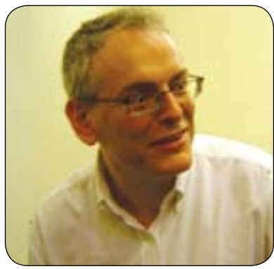
پروڧىسۇر رەمىسىس ئەمەر بۇ گولان:

رۇژئاۋا سەقامگىر و ئارامبىن، بەلام ئەگەر ئاۋرپىك لەسالانى ۱۹۷۰كان بدەينەۋە دەبىنن ياخيپوون و توندوتىژى و پىكدادان لەژمارەيەك لە ۋلاتانى ئەۋروپاي رۇژئاۋا ھەبوۋە، بۇيە بەپراى من ناكرى ئەزمونى ۋلاتانى ئەۋروپاي رۇژئاۋا بكرىت بەنمونە و كۆپى بكرىت لەبەرئەۋى لەۋانەيە ئەمرو سەقامگىر و ئارام بن، بەلام ئەگەر لەمەۋدایەكى دووردا سەيرى بكن دەبىنن بەۋشىۋەيە نىيە كە بىرى لى دەكەينەۋە. يان