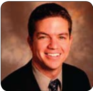
پروفيسور کيلى کلارک بيەردسلى بۆ گولان:

شيتک دەدەن، ئەوا دواتر پايەند نەدەبوون بەرپۆککەوتنەکەيان. لەسەرەتاي ٢٠٠٠دا بينيمان ئەمريکا پتر دەستيوەردان دەکات لەسياسەتى سۇداندا بۆئەوئى رژيمەکەى سۇدان بخاتەبەردەم بەرپرسیارتيبەکانەو و دواتر باشتەر نامادەبوون بۆ رۆککەوتن، کە نەک ئەمريکا، بەلکە ولاتە عەرەبيەکان و ولاتە ئەوروپيەکانيش دەستيوەردانيان کرد لەدابيئکردنى سەرچاو بۆ ئەوئى رژيمەکەى سۇدان بخەنە بەردەم بەرپرسیارتيبەکانى خۆيى و دواتر