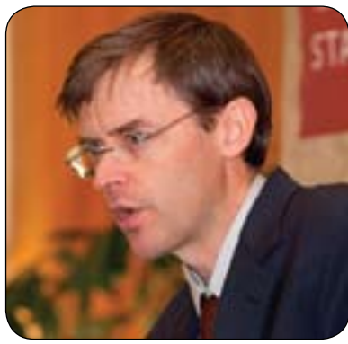
پروفسۆر جامىس فىرۆن بۇ گولان:

پروفسۆر فىرۆن كە لەنزىكەوه ئاگادارى بارودۆخى عىراقە لەوولامەكەيدا ئەوهمان پىدەلەت، ئىستا حكومەتتى عىراق وەك ئەمىرى واقىع هەرىمى كوردستانى وەك هەرىمىكى فيدرالى لەعىراقدا قبولكردوو، لەمەشدا نامازەى بەفیدرالیهەتتى ئەمىرى