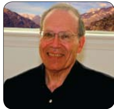
مافوس مدلارسكى بۆ گولان:

بەلام فاکتەری گرنگ لەم پرسەدا ئیرادەى گەلى کوردستان و پشتگىرى راستەقىنەى پرارى سەرۆکەکەيەتى، بۆيە کاتىک پرارى لەمجۆرە دەدرت دەيىت نامادەباشى بۆ دىالۆگ و ليکتيگەيشتن و تەنانەت رۆککەوتنيش لەسەر ئاستى ھەموو لايەنەکان کرايىت و ھەموو لايەک بەتايبەتى لەسەر ئاستى ناوخۆى ھەرئىمى کوردستان نامادەيى ئەويان تىدايىت شانى بەدەنە بەرو خۆراگرين، سەبارەت بەو ئاستەنگانەى لەسەر مافى