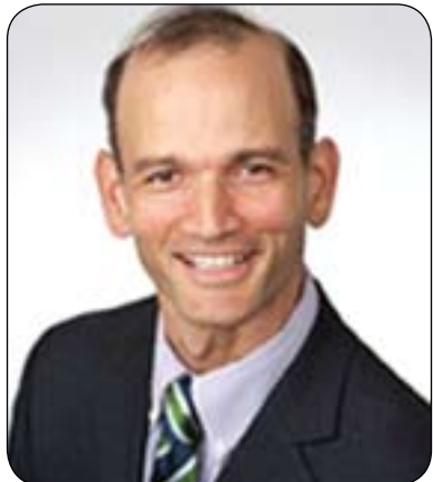
جىرمى پرىسمان بۆ گولان:

دىكەش بەردەوام ئەوہ تاوتوئى دەكەن چون كارىگەرەين لەسەر رەوشى سوريە، ئايا ئەمەرىكا چى دەكات، ئايا فەرەنسا چ رېوشوئىنك دەگرىتتەبەر، ئايا روسيا چى دەكات كە بەرھەلستى دەستتوهردانى نيودەولەتى دەكات، ئايا عىراق چى دەكات، كەواتە چەندىن وڵات هەن كە پىوہندىان بەكىشەكەوہ هەيە...دوو بارە ئەگەر من لەجىي موعارەزەى سوري بوومايە، ئەوا