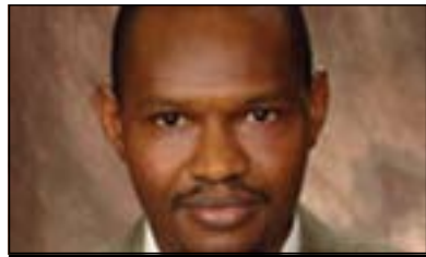
ئەبۆبەکر بەھا بۆ گولان:

سەرچاوەى سروشتى هەیه، پرسیارەکە ئەوئەیه ئایا چۆن داھاتى ئەو سەرچاوانە بەکار دەھێریت؟ هەر بۆیە من لەم چوارچۆنەیدا جیاوازیەکی زۆر نایینم لەنیوان پرۆسەى بونیادنانى نەتەو و پرۆسەى بونیادنانى دەولەتدا، خەلکی لەپێوئەندیدا بەژیرخانى حکومراڤانى و بەخاکەو بیەر لەدەولەت دەکەنەو، بەلام واقیعهکە ئەوئەیه کە تۆ بی دەولەت ناتوانیت نەتەوئەت هەيیت و بی نەتەوئەش ناتوانیت دەولەتت هەيیت، هەرۆهە ئە گەر نەتەو و خاکیشت هەبوو، بەلام دەولەتت نەبوو، وەک فەلەستینیەکان، ئەوا ئەمانجەکە ئەوئەیه چۆن دەولەتیکی بونیاد بنییت، بەتپیراڤانیى من نەتەو و دەولەت کەم تا زۆر یەك شتن. ئیمە لیڤەدا باس لەو