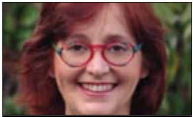
ئوریت رۆزین بؤ گولان:

له پرووی بونیادنانی دیموکراسییه ت، پروسهی بونیادی دیموکراسییه ت زیاتر له ولاته نادیموکراسییه کان سه رکه وتوه، دیموکراسییه ت باشترین سیسته مه به شیویه که پیوسته هاوولاتیان هه ست به وه بکه ن که هاندر له به رده میان هه به بؤ به شداربون، له به رته وهی ته گهر هاوولاتی هه ست به نازادی بکات ته وکات خوی به خاوه نی ولاته که ده زانی ت و هاوکات خویستانه ده ستی شخه ری بؤ ولاته که دی ده بی ت نه ک به زوره ملی، هه ریویه من پیماوه که مه سه له که تنیا په یوه ست نییه به سه رکرده، به لکو هه روه ها په یوه ست به سیسته مه که ییش، به لام سه باره ت به «کوری» ده بینین دوو سیسته م هه به