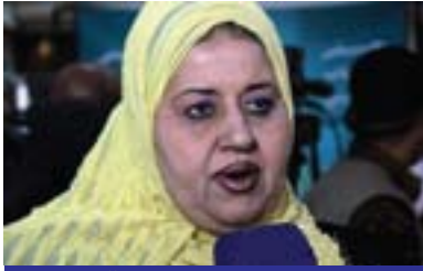
ناھىدە داينى بۇ گولان: