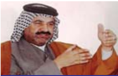
محمدەد سەھیود بۇ گولان: