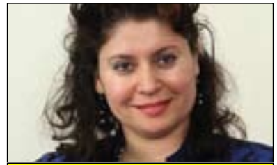
د.هەنادى ئەلسەمان بۇ گولان:

۱- رژیمی ئەسەد، رژیمی حزبی بەعسه، بنەمای ئەم رژیمه لەسەر بنەمای کۆنترۆلکردنى ئەمن و موخابەرات بینا کراوه و هەرۆها بەشیکى زۆرى سەرکردەکانى سوباش چارەنووسیان بەو رژیمهوه گرێدراوه، بۆیه لەوانهیه لەناو سوپا هەندیک لیکترازان یان جیابوونەوه رۆبەدات، بەلام لەناو دوو جیهازەکەى دیکه که ئەمن و موخابەراته وەك رژیمی بەعسى عیراق وابەستەى رژیمهکەن و زۆر زەحمەته لەرژیم جیابینەوه. ۲- تاییهتەندیهکى دیکهى رژیمی ئەسەد و رژیمی پێشوی بەعسى عیراق ئەوهیه ئەو دوو رژیمه قەومى توندپۆن، لەم خالەدا لەگەل سلۆبۆدان مېلۆسۆفیچ یەكده گرنهوه، لەبەر ئەوهى ئەویش هەر لەبەر توندپۆی قەومى دەنگى پێدراو بووه سەرۆکی سربیا، بەلام روسیا زۆر بەتوندی