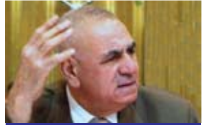
تارىق ھەرب بۇ گولان:

ماڧى خۇيەتى داواى خزمەتگوزارىيەكان بىكات لەرووى تەندروستى و پەروەردەيى و رىنگە و بان... و تاد. لە جۇرەكانى دىكەى خزمەتگوزارىيەكان، بۇيە ھاوولائىتى ماڧى خۇيەتى داواى ھەموو ئەو شتانه بىكات و ئەركى ھكومەتە بۇ داينىكردى، بەلام ئەوئى كە تاكو ئەمرو پىشكەشكراوھ كەم نىيە، بەھىچ شىئوئەكە كەم نىيە، من پارىزەرم و كاتى خۇى لەكۆتائى ۱۹۸۰كان و لە ۱۹۹۰كان كەيسى دادوهرىمان لە «بەسرە» لەئەستۆ دەگرت، لەبىرمە لەو سەردەمەدا بەو رىنگە دوورە دەروئىشتىن تەنيا چەند ژمارەكە ئۆتۆمىيلمان دەينى و لە قەزا و ناحىيەكان ئەگەر ئۆتۆمىيلكى «بەرازىلى» ت دەينى سەردانى ناچەكەى دەگرد ياخود ھەر ئەويشت نەدەينى، لەكاتىكدا ئەمرو لەھەموو قەزا و ناحىيەكان دەينى پرە لە ئۆتۆمىيلى مۇدىل ۲۰۱۱ و ۲۰۱۲، راستە ئەمە شىتىكى باش و نايابە، بەلام ئايا بەپىيى خواستەكانە؟ ئايا گەشىتە كاملبوون؟ بىگومان وەلامەكەى «نەخىز»ە، ئايا ئەو خزمەتگوزارىيەنى كە پىشكەشكراوھ بەپىيى بودجەيە؟ بەسە بۇ «عىراق» لەسەر مەسەلەيەكى دىارىكرارو؟ بىگومان وەلامەكەى «نەخىز»ە، بەلام ھاواكات خزمەتگوزارىيەكان تاراددەكە پەسەندكراوھ و بەقەد ئەو قەبارەيە نىيە كە لە شەقام ھەيە و كە لە مېدياكاندا بلاودەكرىتەوھ».