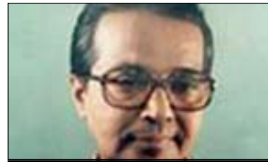
ئامیا چادوری بۆ گولان:

پرۆفیسۆر ئەمیا چادوری نموونەى گاندى بۆ لیبۆردەیی و پیکهوه ژیان لەپروۆسەى بونیادی نەتەو ئەماژە پیکرد، بۆیە لیڤەدا گرنگە ئەماژە بەپۆلى بەرپۆر مسعود بارزانی سەرۆکی هەریمی کوردستان بکریت، کە یەكەم سەرۆک بوو لەولاتی خۆیدا وشەى کەمینهى بۆ نەتەو و جیاوازهکانى کوردستان لایەرد و جەختى لەسەر ئەو کردەو کە ناییت هیچ نەتەو و ئایینی بەنەتەو زۆرینه و ئایینی زۆرینه لەقەلم بەدری و ئایین و نەتەو رپۆر و بەهای خۆى هەیه، ئەوجا بەژمارە کەم بن یان زۆر بن، بۆیە لای پسیوران سەرکردەى