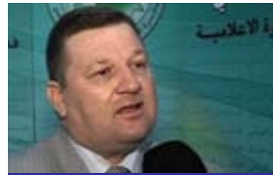
زوهير ئەمەرجى بۇ گولان: