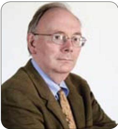
ريچارډ جون بو گولان:

مېديا ههتا پيى دهكرېت باشتري كار چيېه جي بكات له پرووى روومالكردنى رووداوه كان بهو ناسته ي كه مایه ي بهرز راگرتنى ديموكراسييهت بيت، پيويسته ميديا كات و مه جالى زياتر ته رخا بكات بو مه سه له نالوزه كان و گه ران به قولې، ههروها پيويسته ميديا له پرووى داراييه وه «نيكتيفاي زاتي» ي هه پييت، بويه به راي من پيويسته راگه ياندا كاره كان زور چالاك بن و نه وه ل ه تواناياندا هه يه بيخه نه گه ر و باشتري كار بكن و له هه مان كاتيشدا پيويسته سه رنجى جه ماوهر راكيشن له به ره وه ي ميديا پيويستى هه يه به فرؤشتنى به ره مه كاني، بويه وه ده سته پياني جه ماوهر له ريگه ي نه نجامداني كارى باش و چالاكه)). ليره وه گرنگه نامازه بهو خاله گرنگه بكن، كه دنياى هاوچهرخ پيويستى بهويه كه رؤژنامه گه رى خوى وه ك رؤژنامه گه رى خه لك بناسينييت و كارى نه وه پييت هاوولاتييان هانبات بو نه وه ي به شدار بن، نه ك ته نيا سه يري رووداوه كان بكن.