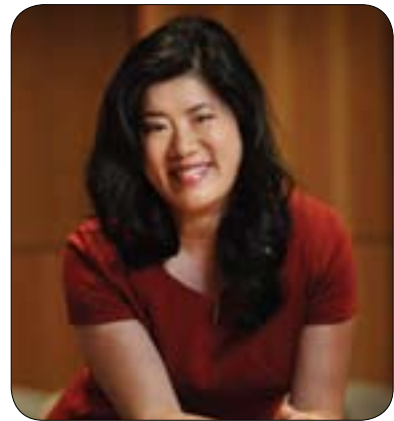
نه نديرا لى پريس بو گولان:

كه واته نه وه ي نه و سپوران نامازهيان پيكره شيوازى هه لسورانى كارى رؤژنامه گه ريه بو چونيه تى هاريكارى هاوولاتييان بو به شدارى و چاره سه ركردنى كيشه كان، له مباره وه پرؤفيسور نه نديرا لى پريس ئوستادى ميديا و سيسيؤلؤزى له زانكوى فيرجينيا له ليدوانيكى تايه تى بو گولان به مجوره له سه ر ميكانيزمى پيوه ندى نيوان ميديا و كومه لگه هه لوه سته ي كردو وتى: (به راي من ميديا له چهندين رووه وه زور گرنگه بو پرؤسه ي ديموكراسى، هه لبه ته نه مرؤ ميديا بو هاوولاتييان سه رچاويه كه بو وه ده سته پياني زانيارى له سه ر پرؤسه ي سياسى و ئابورى و مه سه له زانستيه كان و لايه نه كاني سياسه تى گشتى، بويه نه گه ر ميديا نازاد و ديموكراسى نه پييت، نه وكات ناتوانييت هه وال و زانيارى بو هاوولاتييان داينبكات و له ناكاميشدا هاوولاتييان ناتوان له ديموكراسييه تدا به شدارين. هه ربويه ميديا زور به هتيزه و پيويسته ميديا به ربرسياربه تيبه كاني به جددى له نه ستوبگرېت. بويه پيويسته