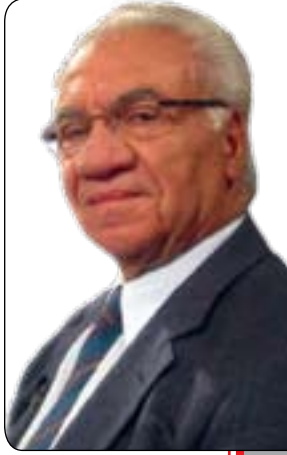
كازم حەبیب ئێنەت بۆ گولان نووسىوتى

بىگومان هەرئێمى كوردستان لەو سالانەى داوییدا لەرۆوى ئاوەدانیهوهو پاش رۆوخانى رژیمی عێراقى وەرچەرخانێكى گەورەى بەخۆوه بىنبو، بەشیۆهیهك شارەكانى هەولێر و سلیمانى و دەھوك لەچاوەسایاندا نااسرێنەوه، ئیستا هەولێر شارێكى ھاوچەرخە لەرۆوى شەقام و پارك و بازارى نوێهوه و هەولێر زۆرىش لەتارییه بۆ چاككردنى بازارە كۆنینه و دیرینهكانى، هەرھوا نۆژەنکردنەهۆى قەلا مێژووییهكەشى كە بەبەردوامى كارى لەسەر دەكړیت، بەشیۆهیهكى وا تا بێتە مەزارگەیهكى گەشتیيارى، ئەویش بەھارىكارى رێكخراوى یونسكو، بەشیۆهیهكى گشتى دەزگا