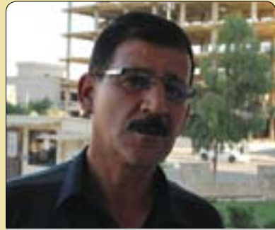
مە رەشوف کەرکوکى