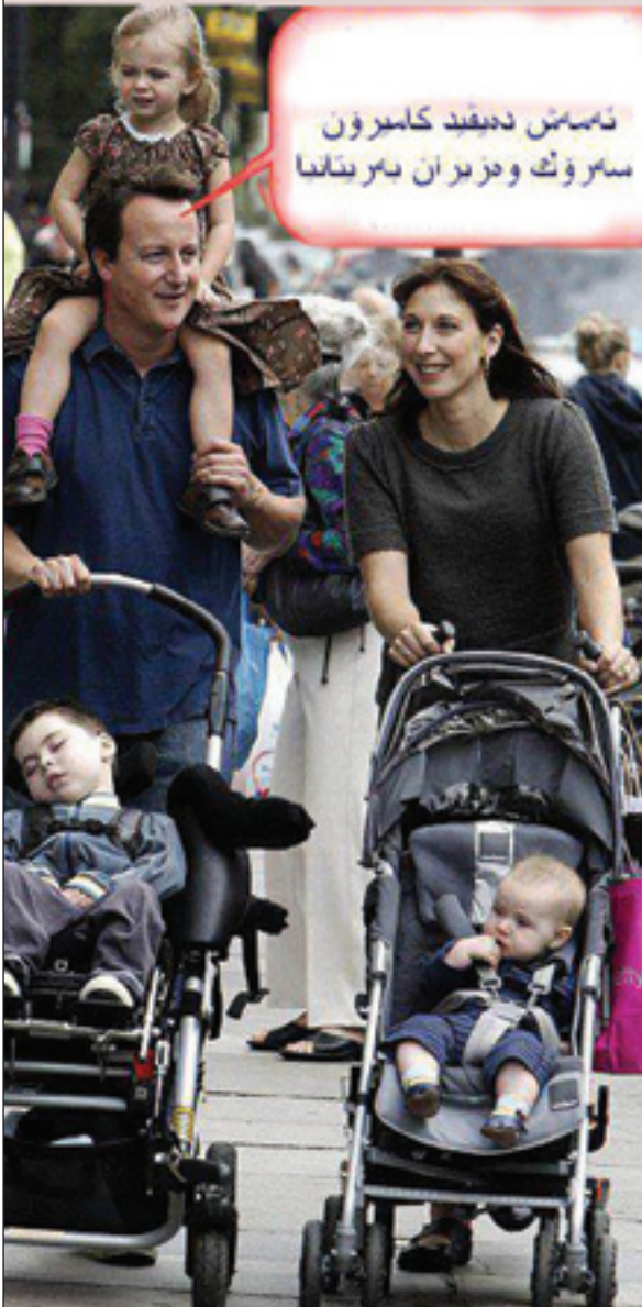
ئاساس دەقىد كاميرۆن سەرۆك وەزيران بەريتانيا

كەسايەتتە جيهانيه كان، بەتايبەت ئەوانەى لەبوارى سياستدا كار دەكەن، خۆيان بەكەسيكى سادە دەزانن و تەنانەت لەدواى دەوامى فەرمييان، خۆيان وەك ھاوولايىيەكى سادە دادەنن، ئەمەش ھەستىكى بوپرانەيە كە تىكەل بەخەلك دەبن واتە خۆيان بە گەورەتر نازانن لەچا و ھاوولايىيانى ئاسايى تەنانەت وەك مەرقىكى ئاسايىش رەفتار دەكەن، نمونەش ئەو وئەيەيە كە (دەيخيد كاميرۆن)ى سەرۆك وەزيرانى ئىستاي ولاتى بەريتانيا كە خۆى و خىزانەكەى و سىغ منداكەى لەبازار خەرىكى گەران و سووران، بەبەى ئەوئەى پاسەوانىك يان كەسيكىان لەگەلدا بى بۆ چاودىرى كردن.