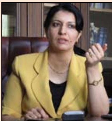
وھىزى كار و كاروبارى كۆمەلایه تى:

ئەوى ئىستا خاوەنى كۆمپانىياكان و كەرتى تايبەت لەبەرامبەر ھىزى كارى لاوانى كوردستان پىادەى دەكەن، پىرژى كەردنە بەمافەكانى ھاوولائىيونى لاوەكان لەناو ولاتى خۇياندا، لەمبارووە گەرچى پىوانى كارى كەرتى تايبەت پاكەنى بۆ ئەو دەكەن، ئەوى كرىكارى بياني بۇيان دەكات لاوەكانى خۆمان نايكەن، بەلام لەو بى ناگايە كە لاوانى كوردستان پىرژى مافى ھاوولائىيون قىبول ناكەن و ئەوى سەرمایەدار و خاوەن كۆمپانىياكانى كەرتى تايبەت بەرامبەر لاوەكانى ئىشە دىكەن لەھەموو ئەخلاقى مرقاىەتى بۆ شىوہى كاركردى ھاوولائىيان دامالراو، ئەمەش پىرژەسى پەرىيدان و ناوئانكردەوى كوردستانى پىچەوانە كەردۆتەوو كەرتى تايبەت لەبرى ئەوى سەرجاويەك يىت بۆ دۆزىنەوى ھەلى كار و خۆشگوزەرانى ھاوولائىيانى كوردستان، بۆتە ھۆكارىك بۆ دۆزىنەوى كار بۆ كرىكارانى بياني و ولاتانى ھەزار، ئەمەش باشترىن ھەلە بۆ سەرمایەدارانى كوردستان بۆ ئەوى لەپىناوى بەرژووندى خۇيان بەم جۆرە مامەلە لەگەل ھىزى كارى كوردستان بكنە، لەمبارووە و سەبەرت بە پەنابردىيان بۆ ھىزى كارى بياني، پىرسارمان لە بەرژ دەشتى ئەمەس بەرژووبەرى بازارى نىبوستى كرد سەبەرت بەوى بۆچى لاوانى خۆمان لەم پىرژانە كار ناكەن؟ لە ولامدا پى و تىن