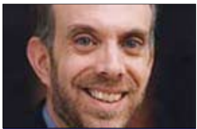
داقيد والندەر بۇ گولان:

پيش ھەموو شت دەبیت ئەوہ بزائين كە ولاتانى عەرەبى ھەموويان ەك يەك نين و پارتە ئىسلامىيەكانى ولاتانى عەرەبى ھەموويان ەك يەك بىر ناكەنەو، بۆيە ھىچ ھۆكارىك نىيە بۆ ئەوہي رینگە نەدریت ئىسلامىيەكان لەپروسةي ھەلبژاردن دوور بخرىنەو، بەلام سەبارەت بە بەرواردكرنى ئەم حالەتە بەتوركيا پيموايە كە زۆرىەي