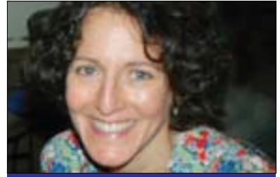
نۇرما كارىبى مۆزورى بۇ گولان: