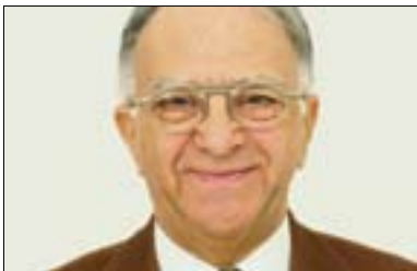
سامى كۆھىن بۇ گولان: