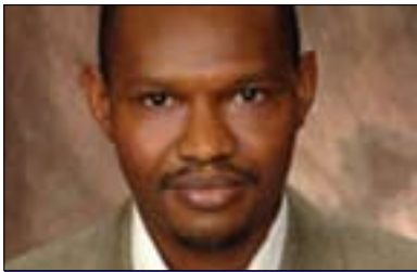
ئەبۇبەكر بەھا بۇ گولان: