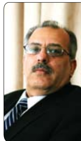
بۆ گرلان نووسىيەتى

ئەم بەھارانه ھاوپەيمايىتى نيوان ھيزە نيودەولەتى و پزىمە سەركوتكارەكانى لىك داپران و شتىكى وای کرد ھاوکارى نيونەتەوھىيەنى كەلانى ناوچەكە و شۆرشەكانى مسۆگەر بکرىت