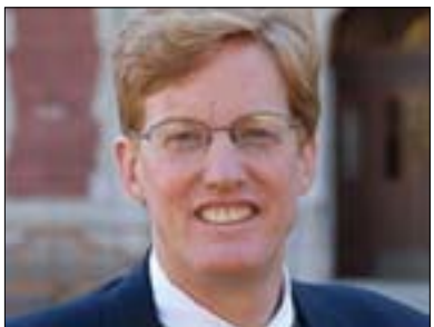
جۆشوا لاندزى بۇ گولان:

(ئاتقۇ) ھىزى سەربازى لەدژى (سويا) بەكاربىنئت. بۇچونى من ئەوئەبە كە نە (روسىا) و نە (چىن) لەنەتەوئە بەكگرتوئەكان پالئىشتى لەو جۇرە چالاكىيانە دەكەن. ھەررەك ئامازەمپىنكرد كەيسەكەى (سويا) زۇر جىاوازە لە) لىبىيا) لەبەرئەوئى (سويا) بەپىنچەوانەى (لىبىيا) ولاتىكى زۇر بەھىزترە و خاوەن دۆستى بەھىزە، لەكاتىكدا (لىبىيا) ولاتىكى بەتەنبايە و ھەكو (سويا) بەھىز نىيە. كەواتە جىاوازىيەكى زۇر لەنئوان (لىبىيا) و (سويا) ھەيە. پىنوايە بوارەكان روون نىيە بۇ پرۇژاوا لەبارەى دەستوئەردان لە) سويا) لەبەرئەوئى بەپىنچەوانەى (لىبىيا) ھىزى چەكدارى لە) سويا) بوونى نىيە كە دەسلەلئى بەسەر نىوئى ولاتەكە سەپاندئت، ھاوئەك ھىچ لئوانىكى روومان نەيىستتوئە لەلايەن ولاتە عەرەبىيەكانى دىكە، تەنبا (بەحرئىن) نەبىت كە ھەندىك دەنگانەوئى ھەبوو لەبارەى دەستوئەردان لە) سويا) و لەلايەنئىكى دىكەوئە