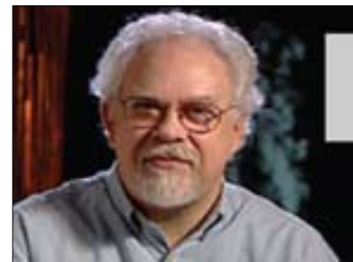
رىچارىد بىولت بۇ گولان:

پرۇفىسۇر لاندزى لەبەر ئەوئى تايەتمەندىيەكەى لەسەر سويايە، بۇيە لەسەر وردەكارى بارودۇخەكە ھەلەستە دەكات و پىنوايە ئەوئە كارئىكى ئاسان نىيە، بۇيە لەم باروئە پرسارىشمان لەپرۇفىسۇر رىچارىد دەبلىو بىولت ئوستادى مئزۇو لە پرۇژەلەئى ناوئەراست و بەرئۆبەرى سەنتەرى دىراساتى پرۇژەلەئى ناوئەراست لەزانكۆى كۆلۇمبىيا كورد و ئەوئىش لەلئوانىكى تايەتەدا بەمەجۇرە راي خۇى