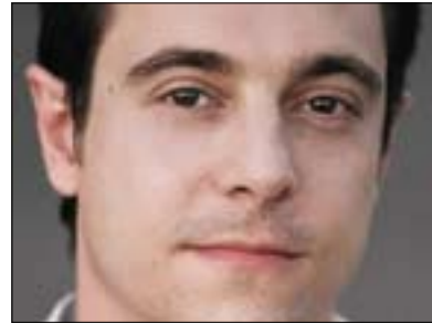
دۇف ۋاكسىمان بۇ گولان:

تاكە سەرۋىكىكى دىكتاتور بونى ھەبوۋ كە ئەۋ جۇرە تۇرەى نەبو، بۇيە جىۋاۋزىيەكى زۇر لەنئوانىندا ھەيە. دوايىن خال كە دەمەۋىئ نامازى پىچ بىكە ئەۋىيە كە، ۋرئى ئەۋىيە نىكەى ۳ ھەزار ھاۋولائى لەلايەن رېژىمەكى (سورىا) كۇرراۋە، بەلام پىموايە بەكارھىنانى زاراۋى (كۆمەلگۈزى نەتەۋىيەك) بەلام ناتوانىن بەكۆمەلگۈزى نامازى پىكەىن. بەراى مەن كىشەى (سورىا) كە ماۋىيەكى زۇر رېۋىدەۋە ئەۋىيە كە كەمىنەيەكە ھوكمرانى دەكات ۋ پىموايە زۇرىنەى (سورىا) پىشان باشتە (سوننە) ھوكمرانىيان بىكات نەك (عەلەۋىيەكان) كە نىكەى ۴۰ سالە نەتەۋەكەى چەۋساندۇتەۋە. بۇيە گەر ئەمە ھەنگاۋەكان بىت بۇ گۇرپىنى ئەۋ بارودۇخە، پىموايە كە ئەمە شىكى پۇزىتقى، بەلام جارى زۇر زەھمەتە بىخەملىنن ئەۋ جىۋۇلە تا چەند پىشتىگىرى لى دەكىت).