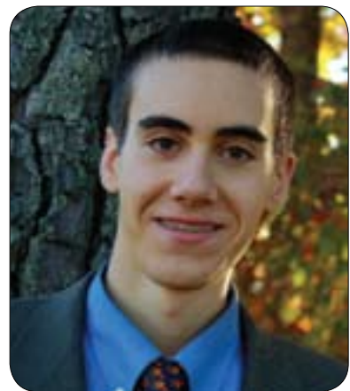
پرۇفىسۇر تىمۇسى ھىلويگ ئوستادى زانستى سياسەتە لەزانكۆى ھۆستن و تاييەتمەندە لەسەر پرۇسەى ديموكراتى لە ولاتانى تازە پىنگەيشتوو يان جىھانى سىيەم، ھەروہا پىسۇرە لەبارى ھەلېژاردن و رەفتارى دەنگلەر لەو ولاتانە بۇ قسەكردن لەسەر ھەستىارى پرۇسەى ديموكراتى لەو قوناخەدا پرۇفىسۇر ھىلويگ