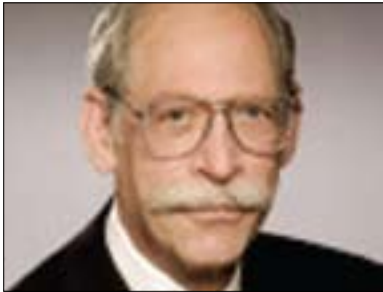
رىچارى كارل ھىرمان بۇ گولان:

بەلام ئەۋدى ئىستا رېژىمى سورىا سەلى لىناكاتەۋە كوشتنى چالاكانانى ئۇيۇزسىۋنە بەناشكرا، سەبارەت بەم لايەنە پىرۇفىسۇر دۇف ۋاكسىمان لەدەررەزى لىدوانەكەيدا بۇ گولان ۋاى پىشاندا كۆمەلگەى نىۋدەلەتسى كارىكى ئەۋتۇى لەدەست نايەت راستەۋخۇ بەرامبەر سورىا ئەنجامى بەت، لەمبارەۋە ۋتى: (چەندەھا رېژىم ھەن لەجېھاندا-كە سورىا تاكە ۋلات نىيە-ئىغىتالى سىياسىيان لەدەزى رىكابەرەكانيان ئەنجامداۋە، چەندەھا رېژىم ھەن لەجېھاندا ئەم كارە