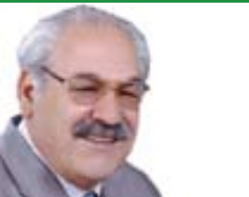
فہلہ گھوڙين ڪاڪھيبي