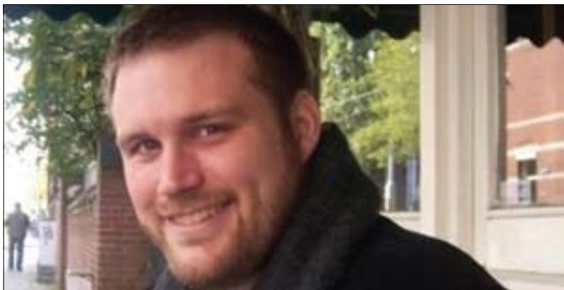
دارىن براھام بۇ گولان:

دەكەن. لە راستيدا نمونەى باشى ئەو دەزگا راگەياندىنەى ھەوال ھەن، بەلام پىموايە كەنالى فۇكس نىوز نمونەيەكى خراپە، ياخود ھەر دامەزراوہيەكى ھەوالى دىكەى گەورەى ئەمريكە. زۆر گرنگە بۇ ئەو كەسانەى كارى راپورتووسى لە كەنالىكانى راگەياندن دەكەن و ئەو دەزگايانە بەرپۆە دەبەن، قەناعەتتىكى شەخسى بەھىزيان ھەيىت بە ھەوالەكان و پابەندىن بە بنەما ئىتتىكەيەكانى رۆژنامەوانىيەوہ، لەبەر ئەوہى تۆ دووچارى گرفت دەيىت كاتىك كەسىك كارى تەحرير لە رۆژنامەيەكدا دەكات ئەزمونى رۆژنامەگەرى نىيە زياتر كارى بازرگانى دەكات. تۆ كارى بەرپۆەردن لە لوتكەى ئەم دەزگايانە دەيىت كە شۆردەيىتەوہ بۇ ھەلسورانى