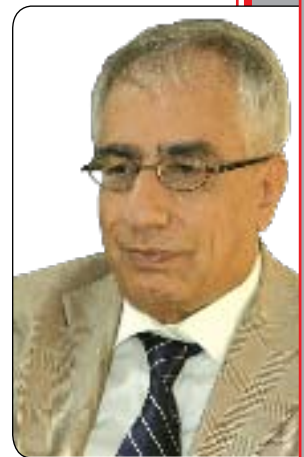
ئىكئور شىرزاڧ نەجار

سەر سەختانە بەرپرسىيارىتى لە ناو يەكئىتى قوتايىيانى كوردستان لە ئەستۆ دەگرت، لە يادىمە كۆتايى سالانى شەستەكان بوو كە پىكەو سەردانى خوالىخۆشبوو غەبدوللا خەدامان كىرد، خەدامان لەو ژوروى خۇيدا يىنى كە بە دىنارىك يان كەمتر بەكرى گرتىبوو، ژوروى كەي زۆر سادە ھاكەزايى بوو، دەكەوتە ئەو كۆلانەي تەنىشت مزگەوتى گەورەي حەيدەرخانەو، لەوئى ھەندىك پارچەي بچكۆلانەي بىلاو كراو چاپەمەنى تەنئىمى يى نىشان دابىن، جىي وەبىرھىتانەو يە كە شانەو رىكخستەكانى تەنئىمات لەو قەرەئىلەيدا شاردراپونەو كە خەداد لەسەرى دەخەوت، لاقەكانى قەرەئىلەكە لە لوولە بۆرى ناوبۆش پىكەتتو، بەلام ئەو پىرى كىردبوون لەو پارچە كاغەزانەي كە مەترسىدار بوون بۆ ژيانى خۇي لەو سەردەمەدا، لە ژيانى ئەو تىكۆشەرانەي يى ئەوئى چاۋەرۋانى پارەو پوول بىكەن سەردەمىكى بەھەرمىن بوو، بى چاۋەرۋانى ھىچ بەرانبەرىك تىدەكۆشان و خەباتيان دەكرد.