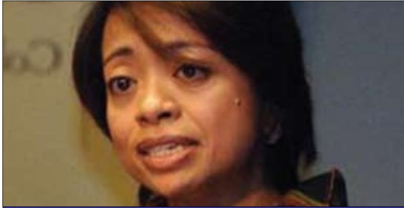
شىلا كۆرنىل بۇ گولان: