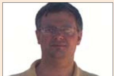
رۆنالڤ ويد بۆ گولان:

مافى برياردانى چارەنووس يەك كى ديكەيه له ئامانجەکانى شۆرشى ئەيلول و وهك سەرۆكى كوردستان ئامازەى پيكرد ئەوى له ئىستا ئايڤندەش هەنگاوى بۆ هەلڤه گيريت بناخه كەى هەر شۆرشى ئەيلوله و لەسەر ئەو بناخه يه وه هەنگاوى بۆ هەلڤه گيريت، هەر شۆرشى ئەيلول كاريكى واپكرد كه تاكى كورد هەست بە ئيرادهى خۆى بكات و هەست بكات كە خاوهنى ئيرادهى خۆيه تى، كهواته بۆ ئەمرو جاريكى ديكە هەولدان بۆ گەيشتن