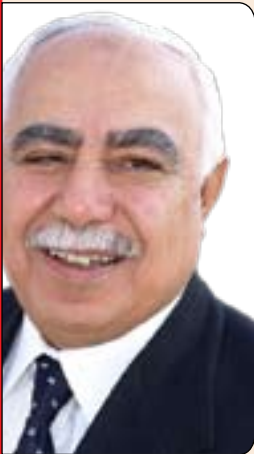
پ. د. نازاد نه قشبه ندى *

۱ - پیناسه کردن و پۆلینکردنی دراوسیکانی هه ریم به شیوه یه کی راست وه که دهوله تانی داگیره کهر. ناییت بۆ تاکه چرکه یه که نه وه له یادکه یین که دهوله تانی دراوسى، نه زمونی هه رتیمی کوردستان به مه ترسی گه وره داده یین له سه ریان