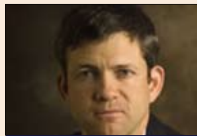
دان ریتەر بۆ گولان: