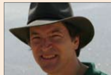
هۆل گاردنەر بۆ گولان:

كهواته ئەگەر ئازادى ئامانجى شۆرشى ئەيلول ييت و لەم قۆناخەدا بەشيك لهو نازاديه بەدى هاتىيت، ئەو پاراستنى ئەو نازاديه خۆى لەخۆيدا دەبىتە دريژەپيڤدەر و بەردەوامى شۆرشى ئەيلول. سەبارەت بە چۆنیه تى پاراستنى ئازادى و گرێدانە وهى بە ديموكراتيه وه پرسيارمان له پرۆفيسۆر شانۆن ستيمسۆن ئوستادى زانستى سياستە لەزانكۆى بىركلى له كاليفورنيا كرد و لە وهلامدا بەمچۆرە بۆ گولان هاتە ئاخوتن: (وهك هۆبز دەلێت ئەگەر خەلكى سەركوت بكریت تا وهكو ژيانيان بەر وهه لڤير ببات، ئەوا ئەو كاتە جياوازى مەرگ و ژيان