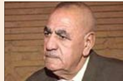
تارىق ھەرب بۆ گولان:

ئەو گۆرپانكارىيانە سەرەخۆييە بۆ ھەرئىمى كوردەكان و تەنانەت گەر دانسى پيئيرت يان نا ئەو ھەر وەك دەولەتتىكى سەرەخۆ مامەلەدەكات. ھۆكارى ئەمەش لەبەر ئەويە ئەگەر حكومەتى بەغدا بەردەوام بىت لەسەر رەفتارە تاكەرەويەكانى، ئەوا كوردەكان بەو شىۆيە بىر دەكەنەو كە ئەمانەويان لەگەل عىراقدا سوودى زياترە، تاكە چارەسەر بۆ ولايتىكى فرەنتەووى ھاوشىۆيە عىراق پيادەكردنى سىستىمى فيدرالىيە، ئەم سىستەمە برىتتەيە لەوى دەسلەلاتى حكومەتە ھەريەكان بەھيژە و دەسلەلاتى حكومەتى فيدرالى نىشتەمانى دەسلەلاتىكى سنووردارە، ئەمەش باشتىر چارەسەرە.. بەرپاى من عىراق دەتوانىت بىتتە دەولەتتىكى فيدرالى باشتىر گرەنتىشە بۆ رىگرتن لەگەرەنەو بۆ ديكتاتۆرى، ھەلبەتە ھوكمرانىي بەرىگەى حكومەتتىكى مەركەزى بەھيژ بۆ دەولەتتىكى وەك عىراق كارىكى ترسناكە و دەبىتتەھۆى سەرھەلدانى گزى و نارەزايى، بەرپاى من روودانى ئەم شتە بىرۆكەيەكى زۆر خراپە، ئەوى كە تىيناگەم ئەويە كە بۆ ئەوانەى «بەغدا» ئەم جۆرە رەفتارانە ئەنجام دەدەن و بۆ بە شتتىكى باشى تىدەگەن؟ بەلام ئەوى راستى بىت، باشتەر وايە ھاوولائىيان لەسەر مەيتۆدى خۆيان رەفتارەكەن، ھاوكات پىموايە كە باشتىر ئەنجام لە سىستەمەكە