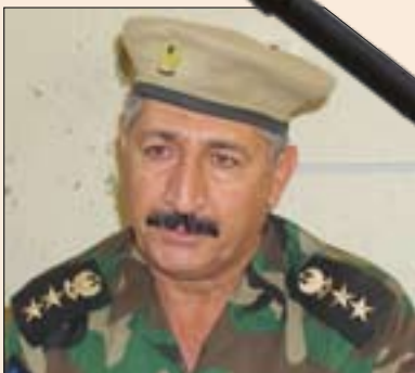
عەقيد سەرتىپ حەسارى

بەرفراوان نىيە كە حكومەتى عىراقى ژمارىيەكى زىاد لە پىويستى سوپاي بۆ ناردووە بۆيە ئەمە لەلای ئىمە جىگاي گومانە كە مەبەستى تر لە پشتىيەويە چ بۆ دژايەتتیی خەلكە كە روويەروونەويەيان لە گەل ئىمە.