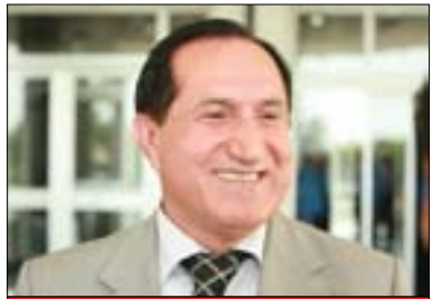
جەغفەر ئىمىكى بۇ گولان:

كىشەمان لەگەل ھەموومانەي ناوہندى بەھەلواسراويى و بىچ چارەسەركردن ماو، نەك چارەسەرى ئەم كىشانە نەكران، بەلكو ھەندىك بابەت و كىشە ھەيە دوايان خستووو جىبەجىكردى رايگىراو ھەموومانەي ناوچە دروست كىشەكانى سەرسنوو و بۇردومانكردى گوندو ناوچە سەر سىنووويەكانى ھەرىمى كوردستان بۇتە كىشەيەكى پىر لەمەترسى بۇ ھەموو لايەكمان، ھەرەھا خەلك و جەماوەر و ھىزە ئۇپۇزسىيۇنەكان ئەوانىش كىشەي خۇيان