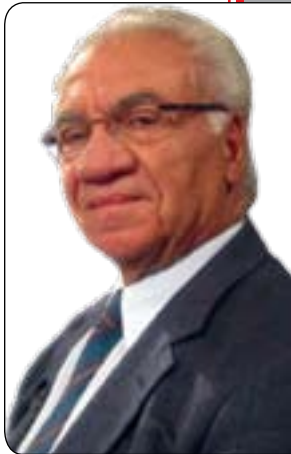
کازم حه‌یب *