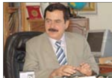
رهشید تاهیر بۆ گولان:

5 قۆلیه که و پاراستنی یه کپیزی نیومالی کورد، ههروهه کاریکی وا ده کات ئیمه له ههریمی کوردستان کیشه و گرفته کانی نیوخۆمان چاره سه ر بکه یسن بۆ ئه وهی بتوانین رووبه پرووی ئهو گرفته تانه بیینه وه که له دهره وهی ههریمی کوردستان روومان تیده کات چ له حکومه تی ناوه ندیه وه یا له لایه ن ولاتانی دهره دراوسیپه، ئه گه ر ئیمه له نیوخۆ کیشه و گرفته کانی خۆمان چاره سه ر نه که ین، ئه وا ناتوانین رووبه پرووی