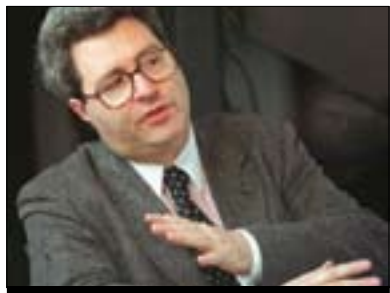
دەمىر گروپىشا بۇ گولان:

ھىچ سىستەمىكى دىموكراتى بى كەموكرتلى بوونى نىيە چەرچل دەيوت لەنىۋ ئەۋ سىستەمە سىياسىيەنەى مەۋقەكان دايانھىناۋە خراپى دىموكراسى لە ھەموۋيان كەمترە