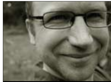
ماكارتان ھەمفرەيس بۇ گولان: