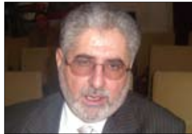
مههمهه فهه رهج بۇ گولان:

بهه رپوه، بويه ليژنه ده ليم به هه موومانه وه دهه ټاين كيشه كان چاره سهه ر بكهين و بهه رنه كارى ههه موو ههه شهه كانى سهه ههريى كوردستان ببهينه وه. ټه ممش ته نيا بهه قسه نايتت بهه لكو دهيتت بهه كار و كرده وه ټه نجامى بدهين، لهه كاته دا دهيتت پهه نهه بخهينه سهه ر كيشه كان و چاره سهه ريان بكهين و ليكتر نزيك ببهينه وهه پروژوه بېراره كانى ههيه جېبه جې بكهين. ټه مهه زه نديهى كه دهه ريت و جه نابى سهروكى ههريى كوردستان له دهه ستيپيشه خه ريه كه دا له گهل