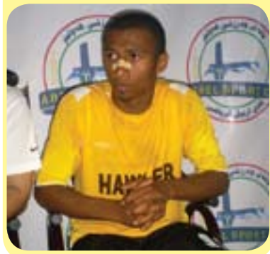
کرا و بۆ ماوهی یهک وهرز یاری بۆ یانهی ههولیر دهکات.

به مه بهستی بههیزکردنی تیبه کهیان بۆ وهزی داهاتوو دهستی کارگیری یانهی ههولیر به فهرمی گرێبهستی له گهڤ حهوت یاریزان مۆرکرد بۆ ئەوهی له وهرزی داهاتوو له ریزی یانهی ههولیر یاری بکهن. یاریزانه کانیش ئەمانه: