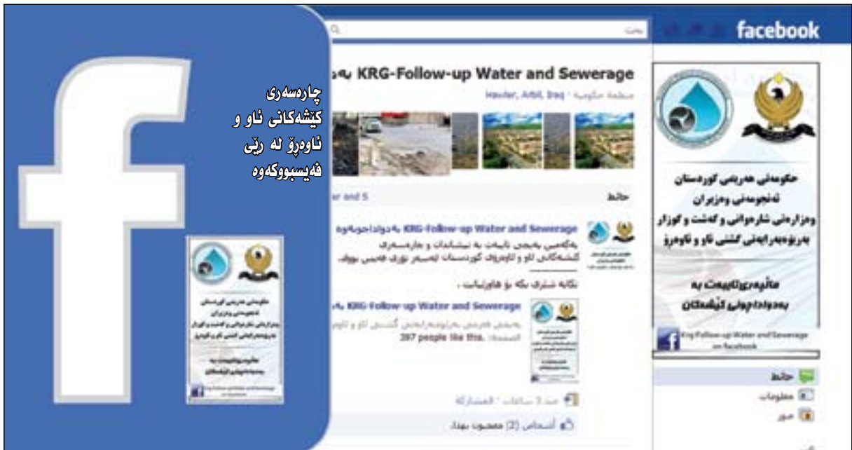
چارهسەرى كىشەكانى ئاۋ و ئاۋدەپۇ لە رېنى ئەيسېۋوكەۋە

ئاۋدەپۇ ھەۋلىز لەۋەدايە شارەكە ئاۋدەپۇ بارانى ھەيسە بەلام خەلكى ئاۋدەپۇ قورسى تىكەل بەم ئاۋدەپۇيە كەدوۋە، ئەو شوئىنەي كە كۇتايى ئاۋدەپۇكەشە كەتۈتتە خواروۋى رۇژئاۋاي ھەۋلىزەۋە ۋىستگەيەكى پالاۋتىنى گەۋرە دوست دەكەين و ئاۋەكە بۇ ئاۋدانى پىشتىنەي سەۋز بەكار دەھىنرېتسەۋە. يەككە لەكىشەكانى ئاۋدەپۇكانى ھەۋلىز ئەۋەيە خەلكى زېل و خاشاك و دەبەي ئاۋى تىدەكەن و دەگېرېت، بۇ ئەمەش لەمانگى ۹ ۋە دەست بەپاكەردنەۋى ئاۋدەپۇكان دەكەين، بەلام تا ھاۋوللايان يارمەتيمان نەدەن زەحمەتە بتوانىن ئاۋدەپۇكانى باران ھەموۋى پاكېكرېتەۋە. سەبارەت بەگېرانى ئەنتەرباسەكانىش بۇ ئەو ئاۋدەپۇ سەرەكەيەكان لە نىك ئەنتەرباسەكانىش بچوۋكن و لەتواناياندا نىيە ئەو ئاۋە زۆرە فېئىدات.