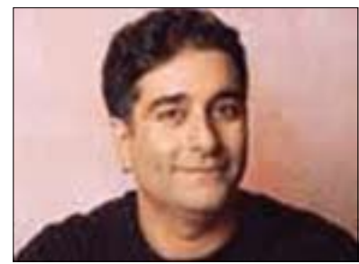
هانی زوبیده بۆ گولان:

چاره سه ره راسته قينه كه ببات كه جيا بوونه وه و دامه زراندي ده ولته تي سه ره به خو يه، بو يه هه مه سو جارنك كه سواري و توويژ له نيوان شوژر و حكومه ته كانى ناوه ندى عيراق هاتوته ئاره وه، لايه ني كورد له عيراقدا داواي هاتنه ناوه وي لايه ني سيهه مي كردوه، بو نمونه نه ته وه يه كگرتوه كان، يان وهك ئيسنا ولاتاني هاوپه يمان، به لام بهردهوام حكومه ته يه كه له دوايه كه كانى عيراق به حكومه تي ئيسنا شه وه، راشكاوانه سواري نه ويان نه داوه لايه ني سيهه م بيته ناو كيشه كه و بو نه وهى وهك ميانگير شاهيد بيت له سه ر