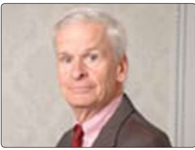
باليۇز چارلس دونبار بۇ گولان: