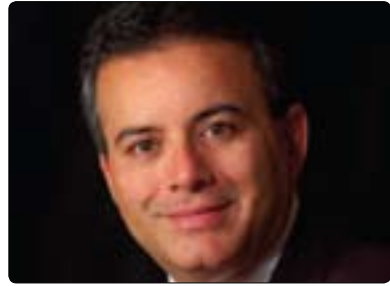
مىھىرزاد بۇرۇچىردى بۇ گولان:

ھەموو ئامازەكان بەرەۋ ئەۋ ئاراستەيەن بارودۇخى سورىۋا بەرەۋ ئاسايىبوۋنەۋە ناچىت و كۆمەلگەى نىۋەۋەلەتەش ھەلۋىستى توندترى بەرامبەر رۇژمەكەى ئەسەد دەيىت