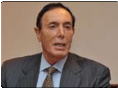
ئالۇن بن مايەر بۇ گولان:

كردوۋە. بەشداربۇونى چالاكانەى ئەمىرىكا لە دوورخستىنەۋەى تالىبان و دروستكردىنى حكومت بە دروستبۇونى حكومتىكى سەقامگىر لە ۋلاتەكەدا كۆتايى نەھات، بەلكى خۇنپىزى و ناكۆكى زىاترى لىكەوتەۋە. ئەو حكومتەى دواى رووخانى تالىبان ھات حكومتىكى كارا نىيە و حكومتىكى گەندەلە، بە ھەمان شىۋە دواى رووخاندىنى سەددام حوسىنەۋە لەلايەن ئەمىرىكاۋە، حكومتىكى پىرۆ-رۇژئاۋايى و حكومتىكى دوست نەبوو كە بەراستى دىموكراتىيىت و بايەخ بە نۆتەرايەتسى كردنى تەۋاى عىراقىيەكان بدات و ۋلاتەكە دابەشبوۋە بەسەر لايەنەكاندا. كەۋاتە لەبەر ئەزمۇونى ئەمىرىكا لە عىراق و ئەفغانىستاندا، ئەۋا زۆرىك لە خەلكى ئەمىرىكا باۋەريان وايە ئەگەر ئەمىرىكا دەستىۋەردان بىكات بۇ يارمەتيدانى موعارەزە، ئەۋا بارودۇخەكە خراپتر دەكات، لەبەر ئەۋە پىيان باشترە خۇى بە دووربگىرت و ئەگەر بتوانىت بەشىۋەى ھاۋكارى مۇۋىيانە لە كاروبارى ئەۋ ۋلاتەۋە تىۋەبگىلن، لەم روانگىيەۋە من پىموانىيە ئەمىرىكا و ئەۋروپا بەشىۋەىكى سەربازىانە لە كاروبارى سورىۋاە تىۋەبگىلن).