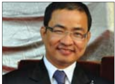
خام خان سوان بۆ گولان:

پێكەویان بەستیتەوه و پێكەویان گرىدات. هەربۆیە پیموانییه بتوانیت لەم بارودۆخەدا پەرە بە فیدراالىزم بەدەت، فیدراالىزم لەئێو ئەو گرۆپانەدا سەرکەوتوو دەبیت كە پىیانوايه شتىكى هاوبەش هەیه لەئێوانیاندا، كە دەتوانن چارهسەرىك بۆ جیوازىەكانیان بدۆزنەوه، لەبەر ئەوه پیموانییه شتىكى مومكین بىت لەو ولاتانەى كە كەلێن و دابەشبوونى قوول هەیه لەئێوانیاندا. لەسوسرادا چەندین كانتۆنى جیواز هەیه كە پێكەوێن، بەلام بارودۆخى سوسرا لەعىراق جیوازە، لەم چوارچۆیەدا تەنیا پەيامى من بۆ كوردەكان