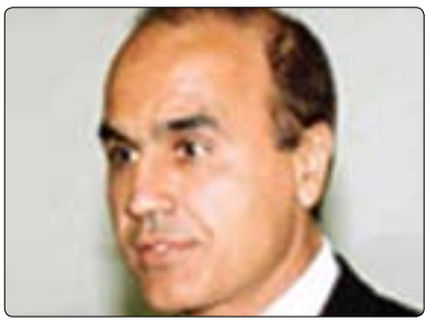
مەنسورى موعەدەل بۇ گولان:

كىن و ياخود پاش «ئەسەد» كى دىتە چىگەى، ەروەها نازان سىياسەتەكان چى دەبن لەبەرەمبەر ەممو كىشە ەرىمىيە جىاوازەكان و نازانىت كاردانەوہيان چۆن دەيىت لەبەرەمبەر «ئىران» و «لوپنان». بۆيە ئەم ەممو لايەنانە شتى ناديارن، كە لەوانەىە واىكردوہ لە كۆمەلگەى نىودەولەتى دوودل بيت لە دەستىوہردان بە ئاستىكى چالاك، بەلام ئەگەر ئەم كۆمەلگۆزىيە بەردەوام بيت ئەوكات ەلۆزاردنەكان لەبەردەم جىھانى ەروہ رۆو لە كەمى دەكات و دانانىش بىچ ئەوہى ەيچ نەكەن. لىرەوہ دەكرىت سەبارەت بە ەلۆستى ئەمريكاش ەلۆستە بكەين و جىاكردەوہىەك بكەين لەنيوان ئەو شتانەى كە پىويستە «ئۆباما» ئەنجاميان بدات لە گەل ئەو شتانەى كە مەبەستىيى بيانكات، ھاوكات پىويستە ئەو شتەيش لەياد نەكەين كە «ئۆباما» كىشەى ناوخۆيى زۆرى لەبەردەمدا ەيە بەتايبەتى لە كۆنگرئس، سەبارەت بە پىكدادانەكانى «لىبىيا» دەستەكانى «ئۆباما» لەو بارەىوہ بەستراونەتەوہ و لەتوانايدا نىبە سەرلەنوئى ويلايەتە يەكگرتووەكان تىوہ گلنىت لە ئۆپراسىوئىكى گەورەى دىكە لە «لىبىيا» و يانىش «سورىيا»،