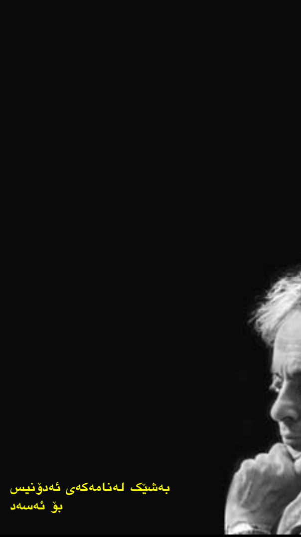
بەشئىك لەنامەكەي ئەدۇنىس بۇ ئەسەد

(ئەقلى و واقع بېرواناكەن، راستەوخۇ دواى رووخانى رژیمی ئىستا، موكراتى لە سوربا بەدبېھتېرىت، لەبەرامبەرىتدا ئەقلى و واقع واناكەن، رژیمیكى ئەمنى سەركوكتار ھەتاسەر لەسوربا لەدەسەلاتدا ئىنتى، ئەمە لەخۇیدا تەلەزگەيەكە، لەلایەك، لەدواى خەباتىكى ووردىزىژ نەبىت، دىموكراتى لەسوربا بەدى ئايەت، پىويستە لە وارچىوئەي ئەو ھەلومەرج و پىرانىسپانەدا بىت كە پىويستە فەراھەم بىرىن دابمەزرىن، بۇ ئەمەش دەبىت ئەمپۇ دەستى پىبىكرىت نەك سبەينى، لایەكى دىكەشەو بەبى بوونى دىموكراتى بىجگە لەكشائەو و گەيشتن كەنارى ھەلدېر ھىچ رىگەيەكى دىكە نىبە... بىگومان ئەو شتىكى وە كە دەلئىن، لەمىژووى ھاوچەرخدا عەرەب بەشئوئەيەكى سىياسىي بە موكراتى ئاشنا نەبوو، ھەروەھا لەمىژووى كۆنىشدا نەيانزانىو، مەش لەبەر ئەوئەيە لەسەر ئاستى رۆشنىبىرى، دىموكراتى دەكەوئە رەوئەي توراىسى عەرەبى، بەلام ئەمە ماناى ئەو نىبە بەشئوئەيەكى ھا مەھالە كار بۇ بوئىادى دىموكراتى لەولاتانى عەرەبى بىكرىت.. كو ماناى ئەوئەيە ئەم كارە پىويستى بەدبىنكرىتى لەلومەرجى بىنەرەتى ھەيە، بەبى ئەم ھەلومەرجە بىچ كارىك بەرھەمى نابىت... يەكەم مەرج ئەوئەيە مەلگە لەسەر ئاستى سىياسىي و رۆشنىبىرى رچەرخىت بۇ كۆمەنگەيەكى سەردەمى ياساكانى سەر نەرز و تاكگەرايى و مرۇقايەتى، يان بە ئانە سىياسى مەدەنىيەكى، جىاكردنەوئەي تەواو ئىوان ئايىن و سىياسەتدا).