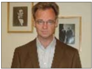
كارل كالتەنتالەر بۇ گولان:

ولات. يەكەك لەھۆكارە گەورەكان لەبىشت سەرھەلدىنى كىشە لە ولاتە فیدرالئىيەكان برىتتىيە لەدابەشكردنى داھاتەكان، بۇ نمونە ئەگەر ھات و دابەشكردنى داھاتەكانى ولات لەدەستى بەشىك لە ولاتەكە بوو، ئەوكات بەشەكانى دىكە، پارىژگا بىت يان ھەرىم، رازى نابن بەو بارە، تەنىا لەو كاتەدا نەبىت كە داھاتەكان و پارەكان بەشىۋەيەكى يەكسان دابەش بىكرىت بەسەر ھەموو ھەرىم و پارىژگانەكان. بۇ نمونە بەپىي سىستەمى فیدرالئى ولاتى «ئەلمانىا» ھەمىشە لەھەلدىلانە بۇ دابەشكردنى