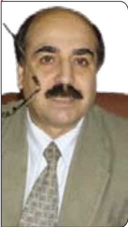
فهرید ئەسه سەرد

ده گه پته وه، كاتيك ته نجومه نى شورای موحاهیده كان كه زهرقاوى رابه رايه تیبى ده كرد له به یانناممه كدا داواى له سوننه كان كرد خۆيان له شيعه جيا بكنه وه وه هه ریمیک له پارێزگاکانی به غدا و سه لاهه ددین و ته نبارو موسل و دیا له به شیکى بابل و واست پیکین. به وهى كه له و کاته دا ناوچه سوننه نشینه كان مه كووى چالاکیه كانى زهرقاویان پیک ده هینا، دياره ته مه به لگه ی ته وه یه كه زهرقاوى له و ناوچانه پشتتگیریه كى زور كراوه به شیکى زوری چه كداره كانیشی له سوننه كان بون.