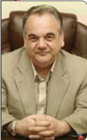
د. ئه نوهر عه بدوللا بهر زنجی

یئگومان ئه م دیالۆگه هه ر له بنه ڤه ته وه په لکیشمان ده کاته لای ئه و ده سه ته بژیژه لیهاتووانه ی که ده توان هاو گونجان و هه ماهه نگی له گه ل ده سه ته بژیژی خاوه ن به یاری دروست بکن له کوردستاندا بۆ گه یشتن به چاره سه ری کارا و ئه کتیه ف که خزمه ت بگه یه نیت به م سه رکردایه تییه سیاسییه ی که ئیستا که وتۆ ته ناو بواره کانی چاکسازییه وه، قسه کردنیش له ده سه ته بژیژی راویژکاران ده مانخاته بهر ده م هه تمیه تی دۆژینه وه پیناسه یه کی ڤوون و دیار بۆ چه مکی راویژکاری و ماهیه ته کانی ههروه ها دینگه زانستی و لیژنایه کانی که پیکه وه میسه دا قیه ت و ره و ابوونی راویژکار ده ره خه ن، له ناو ئه و هه موو راویژکارانه ی ئیستا بوونیان هه یه له ناو