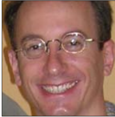
نیلووت گرین بۆ گولان: