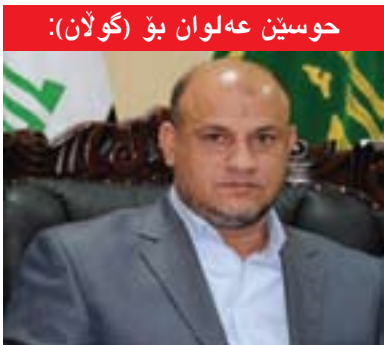
حوسین عەلوان بۆ (گولان):

سربیا مەیلیکی تاکرەویان ھەبوو، بۆیە نەتەوێکانی نیو یۆگسلافیا چیدی کە بواریان نەدا لە ژێر سایە رژی میکی تاکرەوی و دیکتاتۆری بژین و چەند ھەول دەرا بەزەبری ھێز یۆگسلافیا بە یە کگرتوویی بھێنێتەو، بەلام سەرەنجام ئەو ھەبوو یۆگسلافیا لەسەر نەخشە سیاسی جیھان نە ماوێ، ئەو جە ئەگەر لە ئەزمونی یۆگسلافیاو سەیری عێراق بکەین، ئەوا ئاشکرایە عێراق دەوڵەتیکە لە داوی شەری دوو می جیھانی دروستکراو، ھەبۆیە بونیادنانەوێ دەوڵەتیکە بەزۆر دروستکراو پێویستی بە کۆمەڵیک دانپێدانانی واقیعانە ھەبە، نکوولی کردن و پشتگۆی خستنی ئەو واقیعەش ھۆکاری ئەو ھەبوو، کە لە ماوێ نزیکە ۱۰۰ سالی رابردووەو تانیستا عێراق کەم تازۆر سەقامگیری بەخۆیەو نەبینو، لە داوی شەری کەنداوی یە کەمیشەو، گەرەترین کیشە لە بەردەم رینگە چارە نیو دەوڵەتیەکاندا بۆ رزگار بوونی گەلانی عێراق لە نە ھامەتیەکانی، رووخی رژی می عێراق نەبوو، بەلکو بونیادنانەوێ