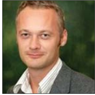
جارلى تروندانل بۆگولان: