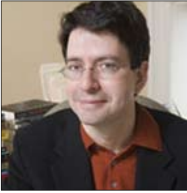
مايكل جۇنز كۇريا بۇ گولان):

چاكسازى و بەھىزكردى دامەزراۋەكان كە لەبەرنامەكەى سەرۋكى كوردستانە گرېدراۋەتەۋە بە پىداچونەۋە بەسىستى دادۋەرى و پىادەكردى سەرۋەرى ياسا و ئەۋەمان پىچ دەلېت بەرنامەكە بەرنامەىكى فراوان و ھەمە لايەنەىە، بۆىە لەم چوارچىۋەىدا پرسىيارمان لە پرۆفىسۇر مايكل جۇنز كۇريا كرد كە ئوستادى بەرپۆبەردىنى حكومەتە لەزانكۆى كۆرنىل، سەبارەت بەۋەى ئايا تاجەند سەرۋەرى ياسا دەبىتە پىداۋىستىەك بۇ بەھىزكردى دامەزراۋەكان؟ پرۆفىسۇر مايكل جۇنز بەمجۆرە ۋەلامى گولانى داىەۋە: (ئەگەر دامەزراۋەى راست و دروستمان ھەبىت بۇ پەرەپىدانى سەرماىەى مرۆبى، ئەۋا بونى دامەزراۋەى بەھىز و دامەزراۋەى بەرەۋپىشچوۋ گرنىگە بۇ پەرەپىدانى پەرەردە و بۇ پەرەپىدانى تواناى مرۆبى لە ھەموو لايەكەۋە، بەلام لەلاىەكى دىكەۋە ئەگەر دامەزراۋەكان ۋەك پىۋىست كارنەكەن، ئەۋا ئەركەكە قورسىتر دەبىت، كەۋاتە پىۋەندى ھەىە لەنىۋان دامەزراۋەكان و بەرەۋپىشچون