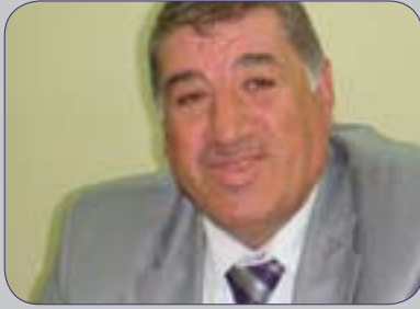
كوردستان لە لىژنەى وەرزشى بە فايلى وەرزشى گولانى راگەياند و وتى «ئەو ۲۰مىليارە كە

ئىمە لە لىژنەى وەرزش و لاوان لەپەرلەمانى كوردستان توانيمان تەر خانى بىكەين بۇ پىرۇژە وەرزشىيەكانى ھەرىسى كوردستان داوى چەندىن كۆبونەوى خۇمان، پىشتىگىرمان كرد لە ھەندىك راسپاردەى وەزارەتى رۇشنىبىرى و لاوان كە ئەوان پىشنىباريان كىردوبو، پاش ئەوەش من و دىكتور سائىر بىرمان كىردەو كە ئەو پارەو پىرۇژانەى ئىستا بۇ وەرزش تەر خان كراوہ لە تموعى وەرزشوانان نىيە، دەبىت ھەندىك پىرۇژەى وەرزشى تىرش بىكەين، پارسال