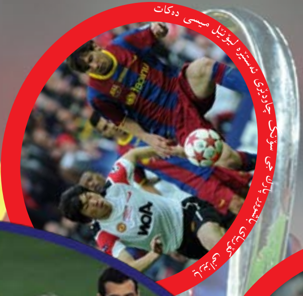
سۈپىرىستېر لىۋىنېل مېسسى دەھات چاۋدۇرۇپى باشقۇرۇپ باراۋەتتى