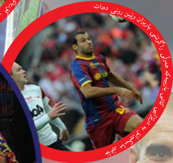
راگنېننى يارىزان وئېن رۈنى دەھات باشقۇرۇپ باراۋەتتى