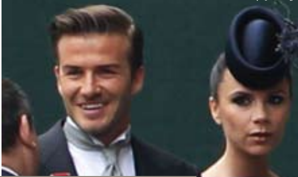
نامادەکردنى ئەم دوو لاپەرەیه: سالار جەلال

یاریزان دیشید بیکھام کە ئیستا لە یانەى لۆس ئەنجلۆس گەلاکسى یاری دەکات و پێشتریش لە یانەکانى مانجستەر یونایتد و ریاڵ مەدرید یاری کردووە دووچاری رەخنەیکى بەهێز بوو لەلایەن هاندەرانى یانەکەى دواى ئەوەى یانەکەى جێنێشت بۆ بەشداریکردن لە ناھەنگى هاوسەرى شازادە ویلیام و کیت میدلتۆن لە شارى لەندەن و گەڕانەوهى لە ماوەى ٢٤ کاتژمێر بۆ بەشداریکردن لە یارییەکی خولى ئەمریکا، بەلام بیکھام ئاستیکى خەراپى پێشکەش کرد و یانەکەى ئەم یارییەى دۆراندا. بیکھام و خێزانەکەى فکتۆریا لە گەل سەج منداڵەکەى لە شارى لۆس ئەنجلۆس دەژین و چاوپێى منداڵى جوارەمیان دەکەن لە مانگی تەمسوزى داھاتوو، شایەنى باسە بۆندى یاریزان بیکھام لە گەل یانەى لۆس ئەنجلۆس لە مانگی تشرینی دووھەمى داھاتوو کۆتایی دیت و بیکھام بە نیازە پێوەندى بە یانەیکەى خولى ئینگلتەرا بکات.