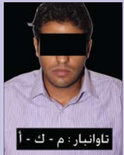
تاوانبار: م - ک - ا

بکات که له‌به‌رده‌م دوکانداره‌که پاره ده‌دزن، هه‌ر له‌و کاته‌ی که ده‌ستگیر کران ب‌ری ۱۷۰۰ دۆلاریان له‌ خاوه‌ن دوکانیک بردبوو و خاوه‌ن دوکانه‌که ئاگادار نه‌بوو، به‌لام دوا‌ی ده‌ستگیر کردنی تنجا زانی دزیی لیکراوه، هه‌روه‌ها دانیان به‌وه نا که تاوانیکێ تریان ئە‌نجامداوه کاتیک له‌رپگی سلیمانی و هاتوونه هه‌ولێر و له دوکانیکێ کاره‌با له هه‌ولێر ب‌ری ۳۰۰ دۆلاریان دزیوه، بۆیه ئێمه‌ش چاوه‌ری ده‌که‌مین خاوه‌ن دوکانه‌کان بێن و سکالایان له‌دژی بنووسن بۆ ئە‌وه‌ی به‌پێی ماده‌ی ۴۵۶ له یاسای سزادانی دادوهری لیکۆڵینە‌وه سزایان به‌سه‌ردا به‌سه‌پینیت.