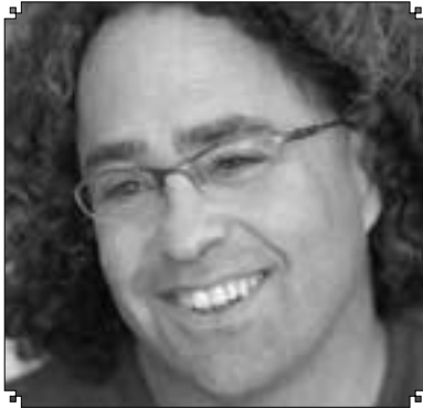
پ. ئەدۋىن ئەمىننا:

دەستورى بۇ مافە سەرەككىيەكانى ھەموۋان. بەۋاتاي دەۋلەت پىۋىستىي بە دەسەلاتىكى تەشرىعى كارا ھەيە لەگەل دادۋەرىيەكى سەرەخۇ، ھەرۋەھا سەرۋكىك ياخود سەرۋك ۋەزىرانىك بۇ مومارەسەكردنى دەسەلاتى جىبەجىكارى. بۇئەۋى ئەم رىكخستەنە بەتپىبەربۋونى كات كارىكات، پىۋىستە كۆمەلگە دان بە بەھاكان بنىت و رىز بۇ مافى كەمىنەكان بنىت، لەگەل قىبۋولكردنى ئەنجامەكانى ھەلبۇزاردنەكان و حوكمىرانىي سىستەمى دادۋەرى پەسەند بىكات. كاتىك كە حوكمەت گەندەل بىت و ياسا بەشىۋەيەكى يەكسان پەپىرۋ نەكرىت، شەرىعيەت دەكەۋىتە رىز