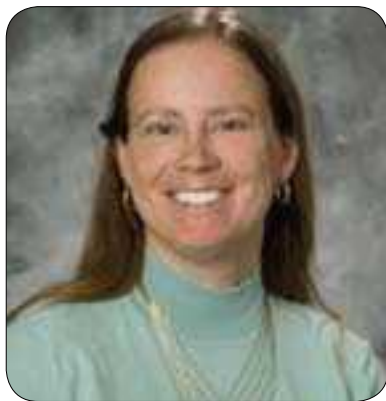
پرؤ فیسور كاسلین برون

له لایه كی دیکه و سه بارته به هه وه له كانی دیکه له سه ر ناستی ناوخۆ بۆ جیه جیکردنی په یامی سه ره وکی هه ریمی كوردستان، بۆ ئه م راپوراته چه ند لایه نیک قسه یان بۆ كرددوین ئه مه بوخته ی بۆ چوونه كانیا نه.