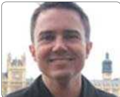
جاسون براونلى بۆ گولان:

دەگىرن، بۆ نەمونه كاتىك دلنابىن كە دەستەبژىرى سیاسى راستگۆ و دروستن یان میدیا سەربەخۆ و بیلايەنەكان كە زانیارىیەى دروست و ورد بلاوودەكەنەوہ، دەتوانین جودایان بکەینەوہ لە گەل ئەو دەستەبژىرانەى كە حكومەت ئاراستەيانى كردوہ، بۆ نەمونه لەمیانى ھەلبژاردنەكاندا، كاتىك كە سیاسەتوانەكان وتار و بەلین پىشكەش دەكەن ئىمە پىشەوختە دەزانین كە قسەكانیان راست نییە و تەنیا لەپىتساو بەرژوونەدیيەكانى