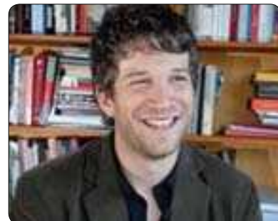
مانویل بالان بۆ گولان:

کۆمەلگەى ديموکراتى ئاشكران و دەپىت ھەموو پىكەو (ھزبەكانى دەسەلات و ئۆپۆزسىيۇن) ھەوللى چارسەر كوردنى بدن، لەم حالەتەدا رۆلى ئۆپۆزسىيۇن لەسىستى ديموکراتى دوو ئاراستەى ئىجابى دەگرىت نەك سلبى، حالەتى يەكەمیان ئەوھىيە كە رىگە چارەى گونجاو و بەدىل پىشنىار دەكات و بەشدار دەپىت لە چارسەر كوردنى كىشەكان، كە ئەمەمیان دەپىتە ھۆكارى ئەوھى بۆ ھەلبژاردنەكانى داھاتوو متمانەى