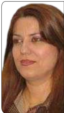
فینۆس فایه ق