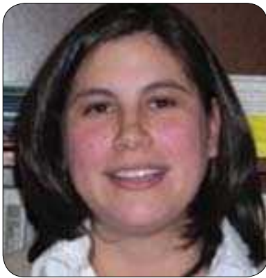
پروفیسور ٹیرکا موریئر

وہ (ہر سہ ماہی) دہ ماہی یاسا دانان و راپہ راندن و دادوہری،، حزبہ سیاسیہ کان، کومہ لگہی مہدہ نی و کھرتی تاییہت و میدیا) کہ ئەمانەش ھەمووی پیکەوہ زەمینیە سازی دەکەن بۆ ئەوہی ھاوولاتیان باشتر و کاریگەرتر بەشدار ی لە گەل دەسلالتدا بکەن، کەواتە کاتیئیک پروفیسور رۆنالد کۆی پروسە کە دەگێریتەوہ بۆ بریاری سەرۆکی ولات بۆ دەستپیکردنی ئەم پروسەییە، ئەوا لەھەمانکاتدا داوای ھەماھەنگیی و ھاوکاری راستەخۆی ھاوولاتیان لە گەل سەرۆکی ولات دەکات، بۆ ئەوہی پروسە ی بە گژداچوونەوہی گەندەلی بگاتە ئەو ئاستە ی سەرکەوتن بە دەست بەیئیت.