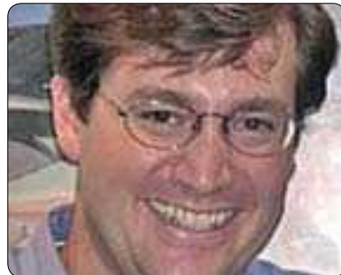
كريستوفەر مان بۆ گولان:

دەبىنن ھەمىشە رېنگەچارەى ناكامل ھەيە لە نۆئەرايەتىكردى ھاوولاتيان. ئەگەر ئىمە ديموكراسىيەتىكى كامل-مان بوئىت، پۆيسىتە بگەرئىنەو بۆ سەردەمەكانى «يۆنانى كۆن» كاتىك كە ھەموو ھاوولاتيانى شار لەشوتئىك كۆدەبوونەو و ھەموويان پىكەو بەرپارەكانيان دەردەكرد، بەلام ئەمرو بارودۆخەكە گۆراو و ھەموو برپارىك دەنگدانى لەسەر دەكرئىت و زەحمەتە وەكو جارن ھەموو ھاوولاتيان لەشوتئىك