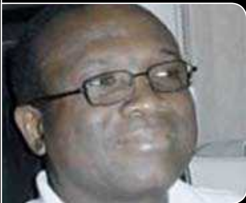
پروۆفيسۆر جۆزىف رۆنالډ بۇ (گولان)

بۇ دژايەتى گەندەلى چەسپاندنى سەرورەرى ياسايەو، دەبىت ياسايەك ھەبىت گەندەلى وەك تاوانىكى بالاً لە قەلەمبەدات و گەندەلكاران سزا بەدات، بۇ ئەوھى بزانن كارى گەندەلى سزادانى بەدواوھە، لەمانەش گرىنگر رۆلى سەرۆكى ولاتە وەك دەسەلاتى يەكەم بۇ بەگژداچوونەوھى گەندەلى، كە پيويستە كارىك بىكات ھاوالاتيانىش لە بەگژداچوونەوھى گەندەلى رۆليان ھەبىت، بۇيە من وای دەبىنم خالى گەوھەرى و گرىنگ بۇ سەرکەوتنى پروۆسەي بەگژداچوونەوھى گەندەلى ھارىكارى و ھەمانگى نىوان ھاوالاتيان و سەرۆكى خۇيانە).