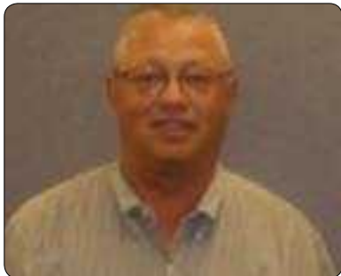
جاميس سۆتۆنلرۆگ بۆ گولان:

دەستىيە سەر ھەل و مەرجەكە، دەستىيە سەر ئاستى پەرورەدە و خوئەنەوارى خەلكەكە، لە ھەمان كاتدا دەستىيە سەر دەستىشانكردى ئەوى كە ئايا دەقا و دەق ھۆكارى نازەزايەتەكە چىيە، لەبەر ئەوى ھەر دۆخ و ھەل و مەرجىكى ديارىكراو پۆيسىتى بە رېنگەچارە و چارەسەرى تايبەت ھەيە، واتە رېنگەچارەكە جىھانى نىيە بۆ ئەوى لە ھەموو ھەل و مەرج و وولاتىكدا بىگرنەبەر. ھەر ھەل كاتىك نازەزايى دەستىيە ھۆى ئەوى خەلكى