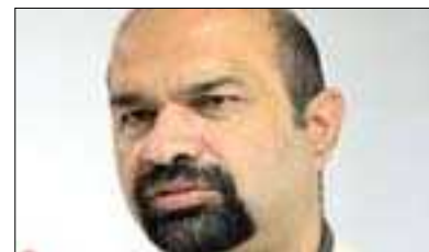
عه لی شه لالا:

پێشوهخته و ماوهیهکی زۆر بهر له ئیستا وتمان دواکهوتن له دهستنیشانکردنی وهزیره ئهمنیهی کان و هیشتهوهی وهزارته ئهمنیهی کان به وه کالهت بهر پوهبهردرین مهترسییهکی گهوهری به داوه دهییت. ههروهک بینهشمان که ولاته که مان که وته بهر هیرشی دۆژمانی عیراق و دۆژمانی دیموکراسیهت. له راستیدا، ئه مه مایه ی نیگه رانییه که پاش سائیک له هه لبژاردنه کان و پاش ٩ مانگ له پیکهتانی حکومت حکومتیکسی که موکورتسی لیده رجیت و به تایبهتی دواکهوتنی وهزارته ئهمنیهی کان که پێوهندییهکی راسته وخۆی هیه له گه ل بارودۆخ و ژیا نی هاوولاتیان. به لام، به داخه وه، به هۆی نه بوونی متمانه یی له نیوان هاویه شه سیاسیه کان و هه ولدان بۆ ده ستدا گرتن به سه ر ده سه لات و ململانی له سه ر بنه مای تایفه گه ری و حزبی رینگه ی نه دا بۆ چاره سه رکردنی ئه م کیشه یه. ئه مرۆ «سی فی» ی کاندیده کانی هه ر یه ک له وهزارته کانی بهرگری و ناوخۆ پێشکه شکر، به لام زۆریه ی ئه ندامانی ئه نجومه نی نوینه ران و قهواره سیاسیه کان ته حه ففوزیان هه بوو له بهاری ناوی کاندیده کان به هۆی ناشیاوی کاندیده کان بۆ وهزارته ئهمنیهی کان. ئه مه مانای ئه وه