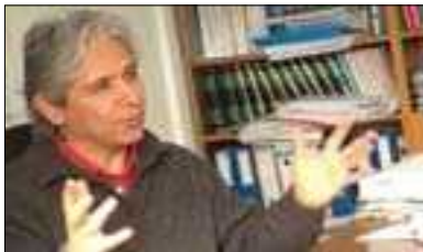
ئيحسان داغى بۇ گولان:

ديارهكانى روزهنامهى تودهى زممانى چاپى توركيya و تايبهتهمند و چاودير لهسهر كيشهى كورد و پيوهنديهكانى نيوان توركيya و ههرىمى كوردستان، بهوى ئايا تاجههده ئەم ههنگاوانهى پارتى داد و گهشهپيدان سهركهوتن دهبن و بهردهوام دهبن له سهركهوتن؟ لههولامى ئەم پرسىارهده پروفيسور داغى بهمجوره راي خوى بۇ گولان خستهروو و وتى: (لهراستيدا تاكيشهى كورد چارهسهر نهين، ئەهوا توركيya ناتوانى لهم رولهيدا سهركهوتن بهدهست بيئى، بهلكو نهك تهنيا لهم باره تهناهنهت لهزور بوارى تريش ئەم كيشهيه وهك بهريهستىك وايه له بهردهم گهشهسهندن و ههنگاوهكانى توركيya وهستاوه، ئەمە كار دهكاته سهر ئيعتبار و هيزى نهرمى توركيya له ناوچهكهده و تا ئەم كيشهيه چارهسهر نهكرى، من پيموايه توركيya