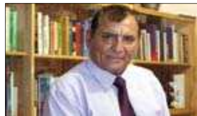
دۇغۇ ئىرگل بۇ گولان:

پىۋەندى بەردەوامە و چىتر ئەم بەرەستانەى نىوانمان نەماوھ. ئەگەر بە وردى سەبىرىكى ئەوھ بىكەين لەماوھى ئەم سى چوار سالى دواى كە لە كۆپوھ پىۋەندىيەكانمان گەبىشتە كۆى، ئەسوا زۆر زياتر بەروونى گرنكى ئەم ھەنگاوى دواى سەھرۇك ۋەزىرانمان بۇ دەردەكەوت، ھەروھە ھەروھو ئامازەم پىكرى توركيا ھەلۇبىستىكى رەسەن نىشان دەدات، ئەم ھەلۇبىستە رەسەنەش برىتتەيە لەوھى كەوا كۆمەلگە و گەلانى ئەم ناوچەيەش پىۋىستە ۋەكو گەلانى رۇژاوا بىنە خاۋەن سەربەخۇبى و مافەكان. ھەربۇيەش توركيا دەبەوئى يارمەتى ئەو ۋلاتانە بەدات كە لەم رووھە كىشەيان ھەيە و ئەگەر ۋلاتىكىش لە ناوچەكەدا ئەم پىرسىيانەى گەشەى سەندىبى، ئەوا توركيا بەشىۋىيەكى پۇزەتقىفانە سەبىرى