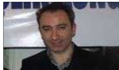
مستەفا ئاكويل بۇ گولان:

ئايا لېرسراوھ كوردەكان تا چەند ئامادەن ھاۋاكارى AK پارتى بىكەن لەم بوارەدا؟ لەبەر ئەوئى من لەوبابوۋەدا نىم كەوا پارتى BDP و PKK رېجكەيەكى نىبەت باشىيان ھەبى! واتە بۇ نمونە PKK زياتر گرنكى بەكەسايەتى سىياسى ئۆجەلان دەدات ياخود بەراستى گرنكى بەماف و سەربەخۇبىيەكان دەدات؟ پىۋىستە برىارى ئەمە بەدات، بىنگومان ئەمانە ھىچ كامىيان بەھانەيەك نىن بۇ ئەنجامنەدانى رىفۇرم، بەلام ئەم كىشەيە دوو لايەنەيە، يەكەمىنيان برىتتەيە لە ھەنگاونانى توركيا بەرە ماف و سەربەخۇبىيەكانى گەلى كورد و لەم رووھوش ھەنگاوى زۆر گەورە ھەلگىرا، بەلام ھىشتا بەس نىبە و پىۋىستى بەزۇر ھەنگاوى ترە. دووھىشيان برىتتەيە لە مەسەلەى دامالىنى چەكى PKK كە ئەمە