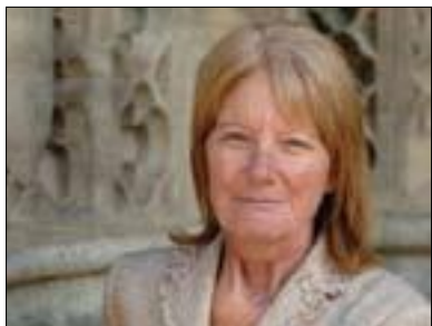
سو نه نسویرس بؤ گولان:

دامه زراوه کانی کوم لگه ی دیموکراتی نه گهر بهیټن باشر تی ریگه ی بؤ نه وهی بوهر نه دریت خواست و داواکاری هاوولاتیان به سیاسی بکریټ، سهارته به چونییه تی بونیادی نه م دامه زراوه له وولاتانی ده سپینیکی دیموکراتیدا، پرسیارمان له پرو فیسور سابرینا رامیت ئوستادی زانستی سیاست له زانکو ی نه رویژ بؤ زانست و ته کنولوزیا ( NTNU) کرد که سپوره له سهر پروسه کانی دیموکراتی