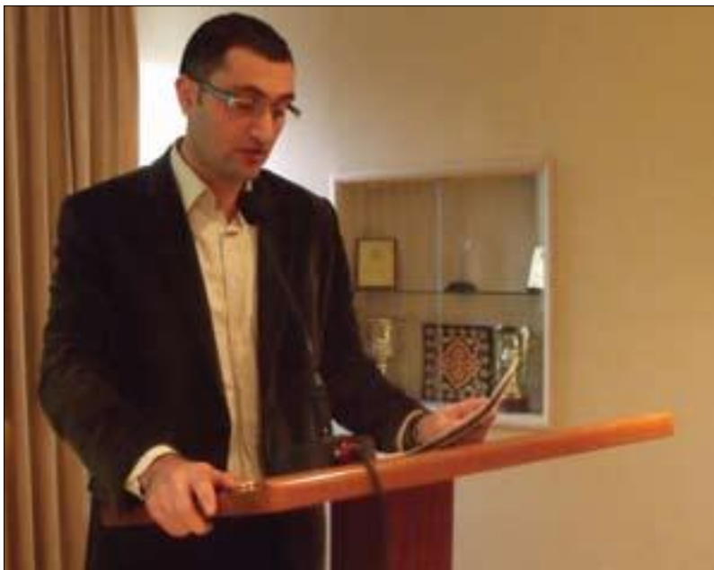
جيهان ئه‌رتەك بۇ گولان: