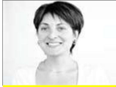
كريستينا پەراو بۇ گولان: