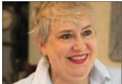
سابرىنا رامىت بۇ گولان:

بلىين گەندەلى بوۋنى نىبىە، بەپىچەۋانەۋە ئىمە پروۋى پرسىيار لەم بزوتتەۋەى گۇران دەكەين و لىي دەپرسىن، ئايا دەتوانىت ۋەك بزوتتەۋەى كى دېموكراتى راشكاۋانە و بىن پەردە و بە داتا و دىكۆمىنتى زانستى بۇمان بسەلمىنىت، لەم پىرۇسەى بوئىادى دېموكراتى و لەم قۇناغى ئىنتقالى كام ولاتدا دىاردەى گەندەلى بوۋنى نەبوۋە؟ ھۇكارى بوۋنى دىاردەى گەندەلى يان دەركەۋەتنى دىاردەى گەندەلى لەم پىرۇسە تازەكانى دېموكراتىدا ھىندەى پىۋەندى بە نەشارەزايى و كەم ئەزمونى بوئىادى ئەم پىرۇسەيەۋە ھەيە، ھىندە پىۋەندى بە خۋاستى