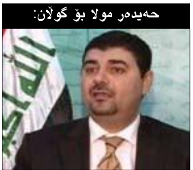
حەیدەر مولا بۆ گولان:

لە دامەزراوەکان بەتایبەتی لەبارەى ئەو کەسایەتیانەى کە شکستیان بە دەستەپێناو، هەروەها بۆ ئەوەى حکومەت بەرنامەیهکی دارپێت بە مەبەستی فەراهەمکردنی مافی هاوولاتیانی عێراقی و دابینکردنی گۆزەرایییەکی باش بە سەر بەرزى و دابینکردنی خزمەتگوزارییەکان... و تاد. هەربۆیە سەماحتی سەید موقتەدا سەر ۶ مانگ مۆلەتی بە حکومەت بەخشی، پاشان پێموایە هەندیک مەسەلە هەیه کە مایەى تاوتۆکردنە لەنیوان قەوارە سیاسییهکان بەتایبەتی لەبارەى لێپچینەوکردن لەگەڵ