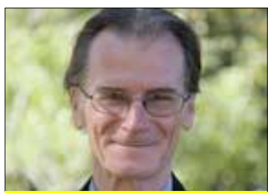
جۇلېۋن ھاۋرۇس بۇ گولان:

ھەمو لايەك قەۋارى راستەقىنەي خۇي بۇ دەرگەۋت، ھەبۇيە كاتىك بزووتتەۋەي گۇرانبىن بانگىشەي ئەۋە دەكات كە ئەۋ نۆنەرايەتتە خەلكى نارەزىي كوردستان دەكات، ئەۋە واقىع ئەۋ راستىيە پىچەۋانە دەكاتتەۋە پىمان دەلېت خەلكى نارەزىي كوردستان (لەدەرەۋەي رېئىخستەكانى يەكېتى نىشتمانى)، ھەتا ئە گەر نارەزىي بىن بزووتتەۋەي گۇرانبىن سەرۋەكەي بەنۆنەرى خۇيان نازانن ۋ، ئەمە واقىعەكە پىئوسىستە بزووتتەۋەي گۇرانبىن قىۋلې بكات، كە خەلك نەيەۋىت ئەۋ بزووتتەۋەي نۆنەرايەتتە بكات، خۇ بەزۇرى