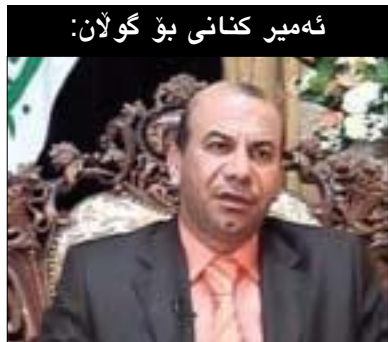
ئەمىر كنانى بۇ گولان:

عىراقدا. خۇپىشاندانەكانى عىراق پەيوەستە بە كەموكورتى لە خزمەتگوزارىيەكان و ئەمىرۋ ھەۋلى جددى ھەيە بۇ ھەمواركردنى سىستەمى سىياسى لە عىراق. ھەربۇيە پىۋىستە جىجابى بىكەينەۋە لەنىۋان عىراق و ۋلاتانى تر لەروۋى خۇپىشاندانەكانى ۋلاتانى عەرەبى و خۇپىشاندانەكانى عىراق كە پەيوەستە بە داۋاكارى و چاكسازى. لەھەمان كاتىشىدا جىۋاۋىيەكى زۆر ھەيە لەنىۋان شىۋازى ۋەلامدانەۋەى حكومەتى عىراقى، لە پارىزگارەكان و ۋزارەتەكان، بۇ داۋاكارىيەكانى خۇپىشاندەرەكان، لەگەل شىۋازى ۋەلامدانەۋەى ھەندىك لە رۇئىمە عەرەبەكان. بۇيە ئەگەر لەم چوارچىۋەدا سەيرى بارودۇخەكە بىكەين، پىمۋايە ھىچ مرقىكى ئاقل لە عىراق خوزارىيە عىراق بىگەرپتەۋە بۇ دىكتاتورىيەت. مرقۇف بە سروشتى خۇى خوزارىە زىاتر ھەنگاۋىنىت بەرەۋ ئاراستەكانى نازادى و نەھىشىتى