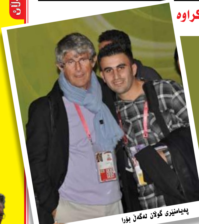
پهيامنيزى گولان ئەگەل بۆرا

بۆرا ميلۆتنۆفيچ تەمەن ۶۴ ساڵ بەكەنەكە لە رايهيندەرە هەرە بە تواناكانى جيهان، ئەم رايهيندەرە خەلكى وڵاتى سربيايە تاكە رايهيندەرە لەسەر ناستى جيهان، كە بتوانيت پينج هەلبژاردە بەگيەنتە جامى جيهانى ئەويش هەلبژاردەكانى مەكسيك (۱۹۸۶) و كۆستاريكا (۱۹۹۰) و ئەمەريكا (۱۹۹۴) و نيچيريا (۱۹۹۸) و چين (۲۰۰۲) و خاوەن ئەزمونينكى زۆرە لە بوارى رايهيندەريەتى، لە هەمانكاتدا لە ساڵى ۲۰۱۰ رايهيندەرى هەلبژاردەى عێراق بوو لە جامى كيشوهرەكان، دواى ئەوى شائدى رۆژنامەنووسانى وەرزشى كوردستان لەسەر ئەركى دكتور كامەران رەهبەرى و بە هاوكارى لێژنەى رۆژنامەنووسانى وەرزشى كوردستان چوونە قەتەر بۆ روومالکردنى جامى نەتەوهكانى، ۲۰۱۱ دواى كۆتايى هاتنى يارى پەلەى سيبەم و چوارەم لە ياريگەى سەد، چاومان بە رايهيندەر بۆرا كەوت لە نزىكەوه ئەم ديمانهيهمان لە گەل ئەنجامدا.