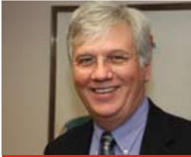
پىرۇفىسۇر مالاچى ھاكۇھىن بۇ گولان:

لە پىشەكى ئەم راپۇرتە ئامازەمان پىكىرد، پىرۇسەى بونىادنانى نەتەو، واتە پىرۇسەى بەھىزكردن و چەسپاندىنى دامەزراوہكانى دەولەت، لەلايەكى دىكە پىرۇسەى بونىادنانەوہى نەتەو زۇرچار لە ولاتانى دوای شەپ دەست پىدەكات، ئەمەش بەو مانايەى پىرۇسەى بونىادنانى نەتەو پىرۇسەى كەلتورى شەپە بۇ كەلتورى پىكەوہ ژيان بەرىگەى بونىيادى دامەزراوہكان، سەبارەت بەگۇرپىنى كەلتورى شەپ بۇ كەلتورى ئاشتى و پىكەوہ ژيان پرسىارمان لە پىرۇفىسۇر ستىفن ئىف جۇنر ئوستادى زانستى سىياسەت لەزانكۇى ماوہنت ھاىكۇل و تايبەتمەند لە كۇمەلگەكانى پۇست كۇمۇنىست، لە لىدانىكى تايبەتيدا بۇ گولان بەمجۇرە لەسەر ئەم پرسە ھاتە ئاخوتن: (بە دلنىايەوہ دەتوانرېت بەرىگەى پىرۇسەى بونىادنانەوہى نەتەو كەلتورى شەپ بگۇرپىت بۇ كەلتورى ئاشتى و پىكەوہ ژيان، لىردە دەتوانىن ئامازە بە ئەزمونى ولاتانى ئەوروپاى دوای جەنگى دووہى جىهان بكەين كە توانىان فىرې پىكەوہژيان و ھاوكارى كردنى يەكتىر بىن، كەواتە ئەمە شىتىكى مەحال نىيە، ھەرچەندە ئەزمونى ئەوروپا تا راددەيك جياواز بوو، لەبەر ئەوہى يارمەتتەكى نىودەولەتسى گەورەى بۇ داىىنكرا بە تايبەتسى لەلايەن ئەمريكاوہ لە رىنگەى پلانى مارشالەوہ، كەواتە ئەو ولاتانەى لە قۇناغى شەپ دەربازيان بوو، پىويستيان بە سەرچاوہ گەلىكى زۇر ھەيە بۇ ئەوہى دووبارە خەلك بتوانىت لەسەر پىنى خۇى بوەستىت، بۇ ئەوہى بتوانىت ژيانى ئاسايى دەست پىيكاتەوہ چونكە كە ژيانى ئاسايىت دەستپىكردەوہ ئەوكاتە زياتر دەتوانىت لىيور دەبىت لە ئاست كەلتور و گروپە جياوازەكانى دىكەدا كە لە گەلىاندا دەرىت. بۇ نمونە ئە گەر لە كۇسۇقۇ برونىن، ئەوا لەبەر ئەوہى كۇمەلگەى نىودەولەتسى ھاوكارىەكى زۇرى كىردو، ئەوا دەرفەتەكانى بەرەپىشچون و چەسپاندىنى دىموكراسى زىيادى كىردو