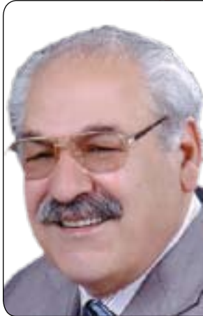
فەك الەىن كاكەبى

۱- ھەولۇدان بۇ وەرگرتنى دەسەلاتى داھاتوو، كە ماىيە