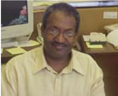
پروفېسسور كىدان مىنجىستىب بۇ گولان: