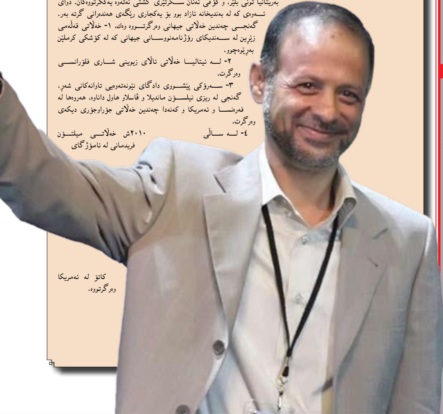
كانۆ لە ئەمريكا وەرگرتووه.

۴- لە سالى ۲۰۱۰ش خەلاتى مىلتون فرىدمانى لە ئامۆژگای