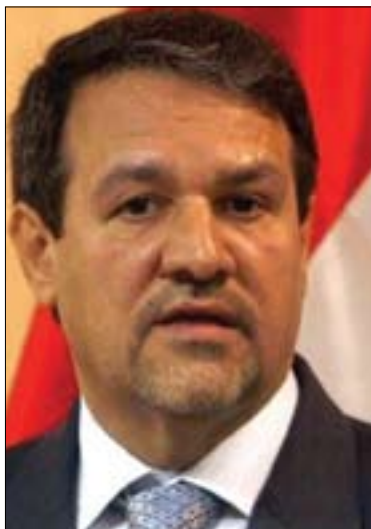
عەلى دەباغ ۋە بىرئى قەۋمى ھۆكۈمەتى عىراق بۇ گولان: