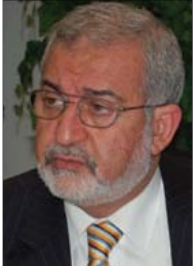
ئەياد سامەرائى سەرکردەى تەحالفوى وەسەت بۆ گولان: