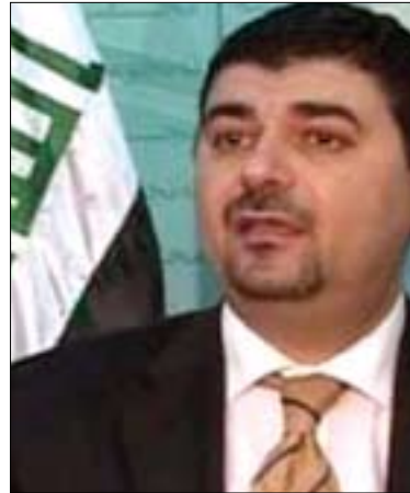
ھەيدەر مولا ۋتەبېئى لېستى ئەلەراقىيە بۇ گولان:

بوۋنى پەرلەمانىكى كارا بۇ حكومەتى شەراكەتى نىشىتمانى پېۋىستە، سەبارەت بەم پرسە لە سەرۆكى پېشۋوى پەرلەمانى عىراقمان پرسى ئايا چارۋەپېنى دەكرېت پەرلەمانى ئىستا بتوانىت رۆلئىكى كارا بگېرېت؟ لەۋەلامدا ئەياد سەمەرائى پېى