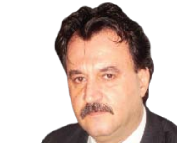
بەھات جەسەب قەرەداخى

لەكار دەترازى و پەتاي ئەم بى سەرۆبەرى و فەوزايە بەجۇرئەك تەشەنە دەكات كە ئىدى مەھالە بە ئاسانى چارەبىكرىت . ھەر لەبەر ئەو سەرەتا خراپەيە كە لەنيو كايەى رۇژنامەوانى و مېدياكارى كوردى ئەم ھەرئەمدا، كەلچەرىك (فەرھەنگىكى) تاغون ئاسا، بەخىزايەكى سامناك و كوشندە بلاو بۆتەو و جىي بەھەموو بەھا و نەرىت و پىوەرەكانى پىش خۇى لەق كرووو كرووونىيەتە دەرەوى كايەكە ! مەبەستم فەرھەنگى (ھەموو راستىيەكان لاي منە و تۆش ھەموو گىيات ھەلەو چەوتىيە) (من فرىشتەم و تۆ شەيتان) (من دەستپاكم و تۆ گەندەل) (من نىشتان پەرورەم و تۆ ناپاك و بەكرىگىراو).