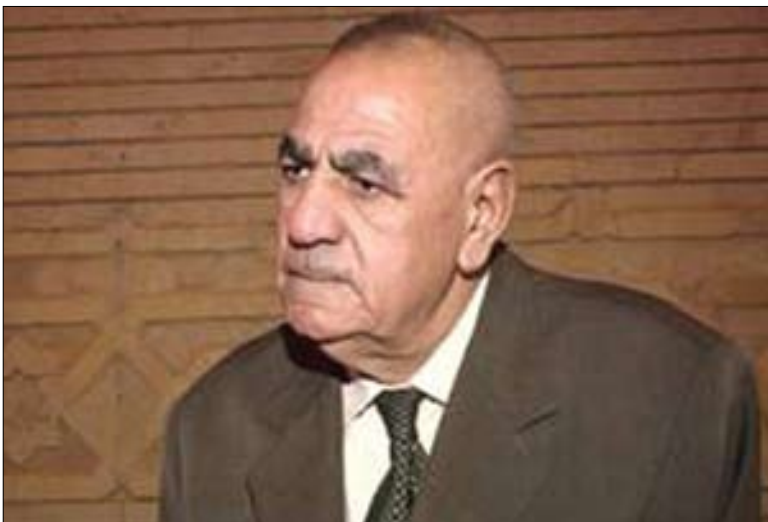
تاریق حرب یاساناسی ناسراوی عیراق بۆ گولان:

جگه له نهگه ری راگه یاندنیک تاکو جه ژن، هیچ موفاجه نه یه کی دیکه بوونی نییه