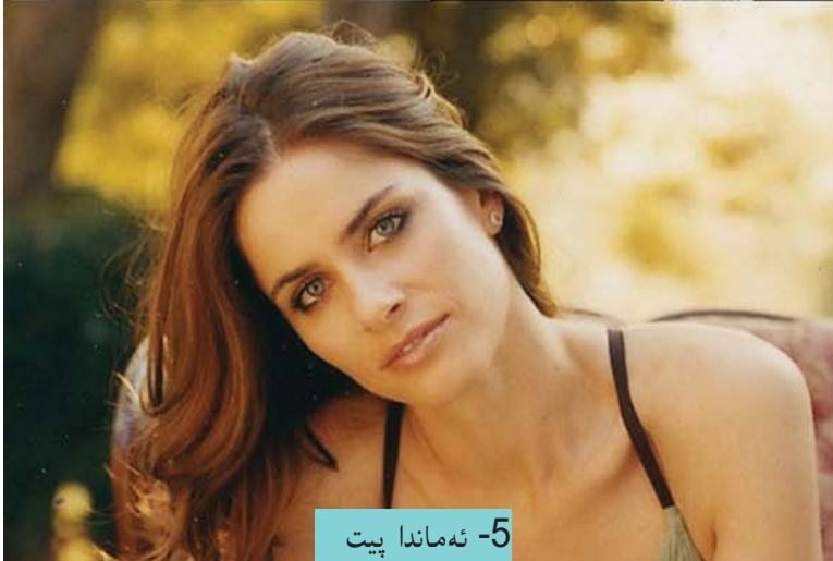
5- ئەماندا پىت