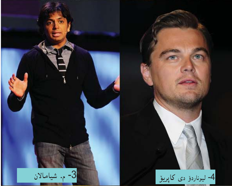
3- م. شىمالان