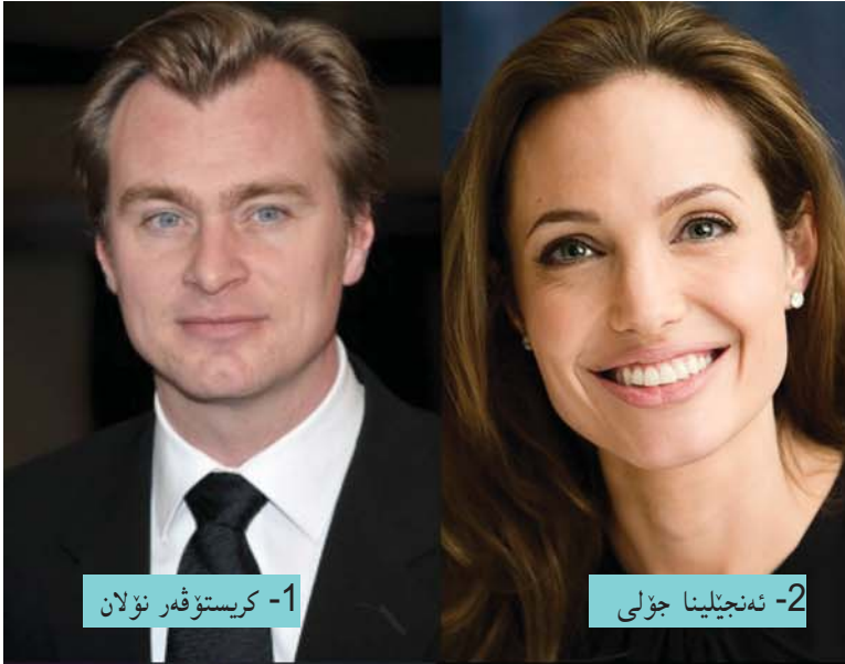
1- كرىستوفەر نۆلان

باشترین ئەكتەرى ھەلبۇزۇرداۋى جەمئۇدە لە مانگى ئەمموز