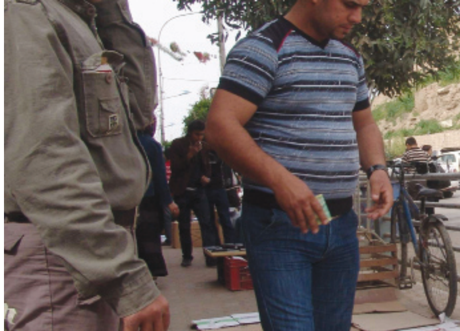
سنى دراوو ھەوالەش دا لەشێخەللار بازارى دراو كەم سەر شەقامەكان لەسەر مقەبا مامەلەى دراو ئەنجام نەدەین

کردنەھەدى ١٥ كونسولخانەو ھاتنى زیاتر لە ٦٠٠ كۆمپانیای توركى ئەو راستیە دەردەخات ئەم ھەرىمە لەناوچەى رۆژھەلاتى ناوەراست پینگەى ئابوورى خۆى ھەبە،