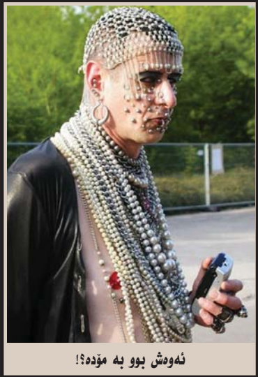
ئەوەش بوو بە مۇدە!