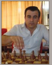
ديار حەمە سەلح

يانهى وهرزى شه ترهنجى خانزاد وهكو نهرىتى سالانهى خوى له دريژهى كارو چالاكيبه كانى خوى وهكو پروگرامه كانى كار كردن بهمه بهستى پيگه ياندىن و دروست كردنى ياريزانى شه ترهنج بوشارى ههولير، خوليكى فيركردنى بوا نزيكهى زياتر له بيست منداى بوماوى شەش رۆژ ئەنجامدا، ئيمەش سەبارەت بەم خولە ئەم راپۆرتەمان ئەنجامدا.