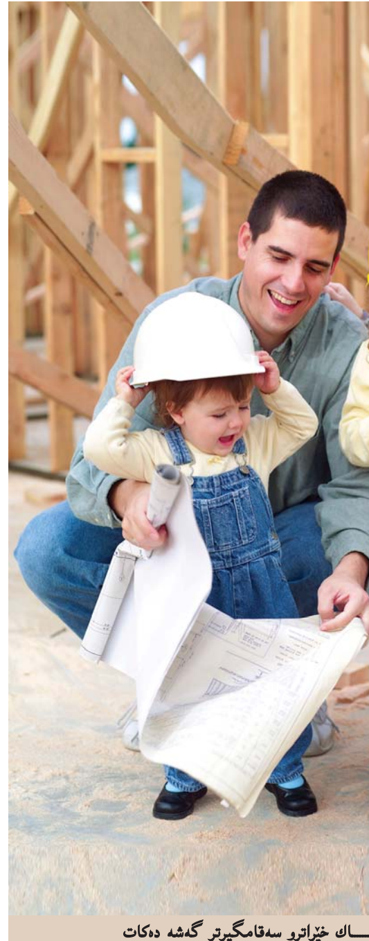
ك خێراتو سه قامگيرتر گه شه ده کات

ئەزمونی سەنگا فوره له به ره نگار بوونه ی گه ندەلی بۆ ئیمه ی کورد به سووده،