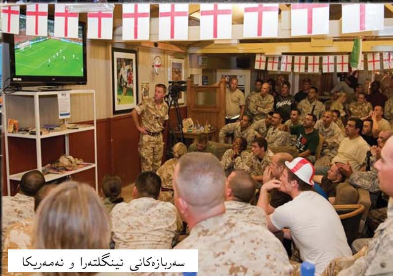
سەربازەكانى ئىنگلتەرا و ئەمەرىكا