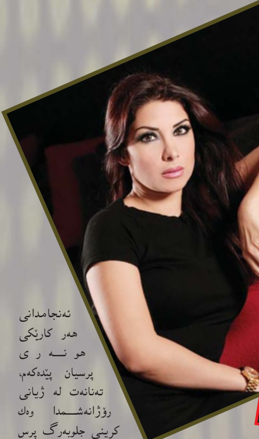
ئەنجامدانى ھەر كارىنكى ھونەر پرسىيان پىدەكەم، تەننەت لە ژيانى رۇژانەشمدا ۋەك كړينى جلوپەرگ پرس بە ھەندىك كەس دەكەم.