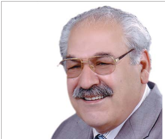
فه که دین کاکه یی

بهایی: له مانگی حوزپراندا، له نامه (دیاریه کر) و شاری وان و موکسی یادی فهقی تهیران، شاعیری نه مری باکووری کوردستان ده کرتهوه، که سالی ۱۵۶۴ ز (هه ندی) ده لاین له ۱۵۱۴ ز) له شاری موکسی له دایکبووه و له وی کۆچی دوایی کردوه. شاعیری فهقی تهیران قوناغینکی گرنگی شاعیری کوردیی، مۆرک و ناوه پۆکی گهشی نیشتمانی و سۆفیگری و عیرفانی بهرز به شاعیرییه وه دیاره. به م بۆنه یه وه نهم وتارهم بۆ کتیبیک ناماده کردوه که به یادی فهقی تهیران له دیاریه کر دهرده چیت، به سوودی ده بینم بیخه مه بهرچاری خوئنه رانی خۆشه ویستی هه فته نامه (گولان).