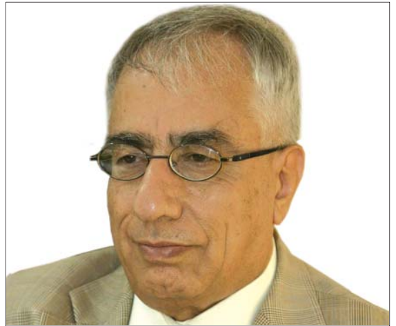
د. شیپزادنه جار *

- به ره پیدانی سواری نابوواری و زیاد کردنی وه به رهیسان، هه ره ها جیه جیکردنی ریفورمخوازی سه رمایه داری و رینگه خو شکردن بو که رته تایه ت که ببیته هاوبه شیکه ی به هیژ له ناراسته کردنی