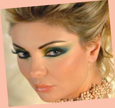
لە رووخسار بدرى و لە گەل ئەو دەشدا سەرتاپاي شويئەكان دەرىكەون لە رەنگى ئەو ماكيازە.

ماكيازەكانى دەم وچاۋ لە چەند شيويەكى ناسك و جوان دەردەكەون، كاتىك خانمان بىيانەوى ماكيازىك ھەلبۇزۇن بۇ رووخسارىيان، لەوانەيە تووشى سەرسوپرمان بن لەوى چ جۆرە ماكيازىك نامادەبەكەن، بە تايبەت كاتىك خىرا دەبن لە پىش بۇنە و ناھەنگەكان، بەلام دەكرى سوود لە چەند جۆرە ماكيازىك ۋەرىگرىن بۇ ئەوى لە گەل گشت جۆرە شوين و بۇنەيكە بگونجى، ئەمەش لە رىنگى ئەم ھەنگاۋانەى خواروۋە :