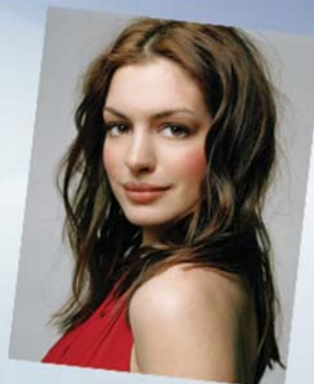
ئانا ھاساوى ۲-۲