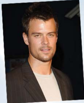
جۆش دوھامیل ۵-۵