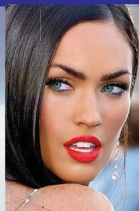
مېگان فۆكس ۱-۱