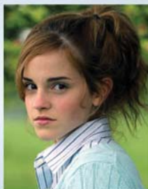
ئېما واتسۆن ۳-۳