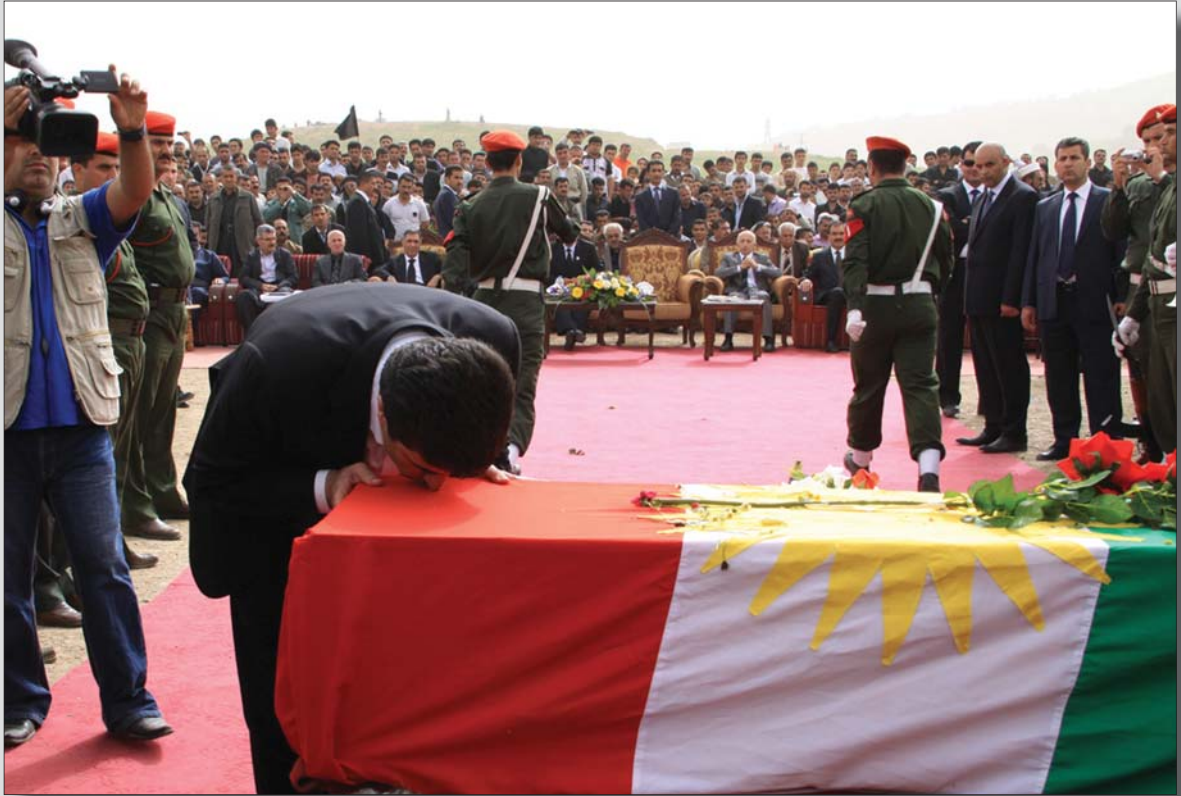
کاتیگ ریز له رابردوی خۆتان دهگرن، دهتوانن ئایندهی خۆتان بونیادبێننهوه

که رابردوی خۆتان ریز لیگرت دهزانن ئیوه له کوئوه هاتوون و به رهو کوئ ههنگاو هه لدهگرن