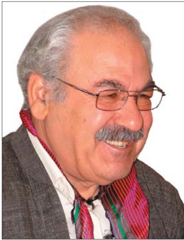
فهلهكه دين كاكه يي