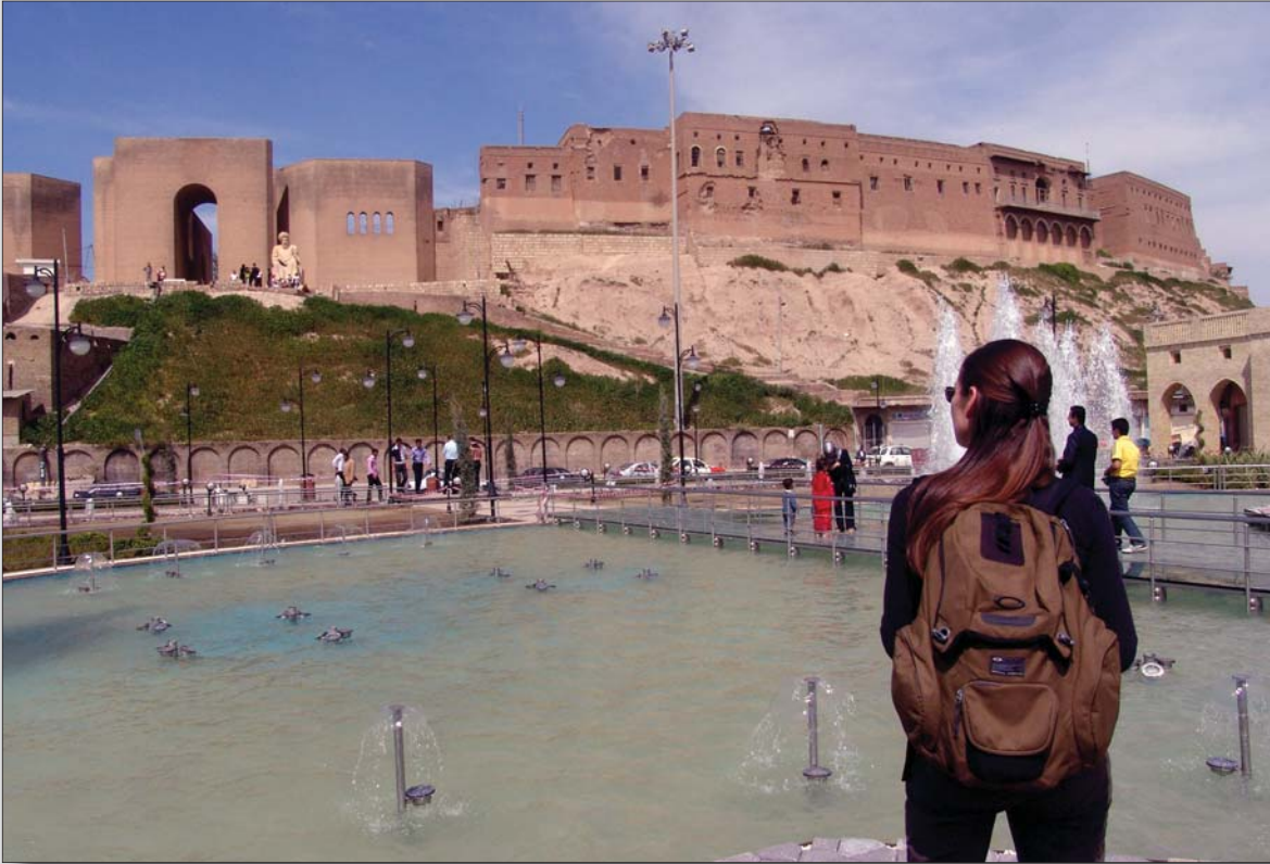
هیچ کاتیک رابردوی خۆتان له بېر نه که ن