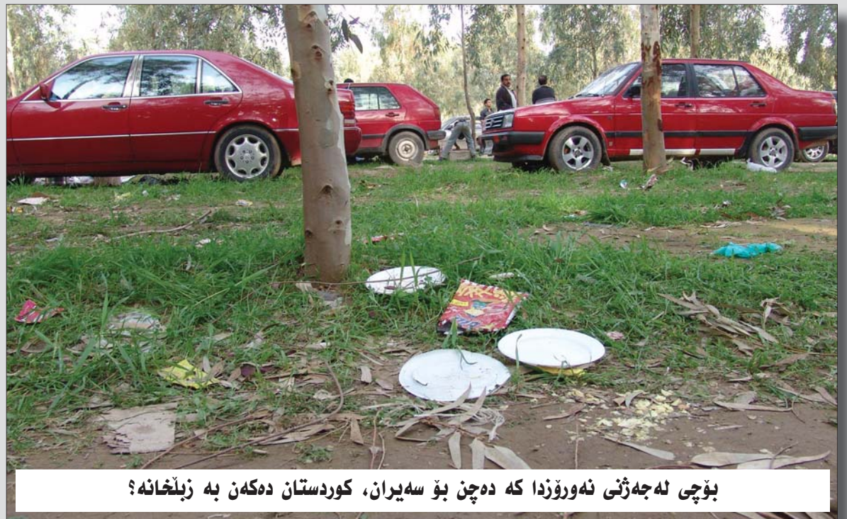
بۆچی له جه رنی نه ورۆزدا که ده چن بۆ سه یران، کوردستان ده کهن به زبڵخانه؟

فه رهنسا له ریگه ی وه زا ره تی شاره وانی و گه شه توگوزاره وه ده یه ویت کار له سه ر بواری په ره پیدانی گه شتیاری له کوردستان بکات، به ئومیدین له و سه رانه ی جه نابی سه رۆک بارزانی بۆ فه رهنسا ده یکات، ریککه وتنیک بۆ بواری شوینەواره کان و په ره پیدانی گه شتیاری له کوردستان له گه ل فه رهنسییه کان ئیمز ابکریت