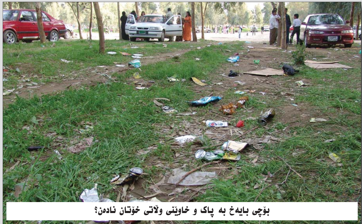
بۆچی بایەخ بە پاک و خاوینى ولاتی خۆتان نادەن؟

۱- دەوێت ھەولەکانى خۆتان زیاتر بکەن بۆ ئەوەى ئەو تاوانە بە ژینۆساید بناسرین لەسەر ئاستى عێراق و جیھان. ۲- دەوێت داھاتوو بونیادبنین و ھەولەبەن جارێكى دیکە کارساتى لەو شەبەھە دووبارە نەبیتەوہ. * سەبارەت بە بونیادنانەوہى داھاتوو، دەخوایم ئاماژە بە بونیادنانەوہى پاریس بکەم دواى شەھرى دووہى جیھانى، ئەم پاريسە جوانەى ئیستای فەرەنسە، لەسەر ئاسەوارى پاريسە کاولەکەى دواى جەنگى دووہى جیھانى بونیاد نراوئەوہ، ئەگەر ئەو پرسیارە لەبەرپۆت بەکەم، ئایا ئەو ئیرادەو توانایە لە کوردا دەبینین، کە بتوانیت لەسەر ئاسەوارى کاولکاری ولایتى جوان بونیادبنیتەوہ؟ - نەك ھەر ئەو توانا و ئیرادەبە دەبینم، ئیستا کورد لەناو بونیادنانەوہبەھەى تەواوادیە، فەرموو با سەھرى ھەولير بەکەن لەھەموو جینگایەك بونیادنانەوہ بەردەوامە، بونیادنانەوہکەش لەھەموو ئاستەکاندا، لەسەر ئاستى بونیادنانەوہى سیاسى دەبینن ئەو پەرلەمان و حکومەتى كوردستان دەبینن، لە عێراقدا دەستوریک ھەبە بەپێى ئەو دەستورە كوردستان ھەریمیکى فیدرالییە، بونیادنانەوہى