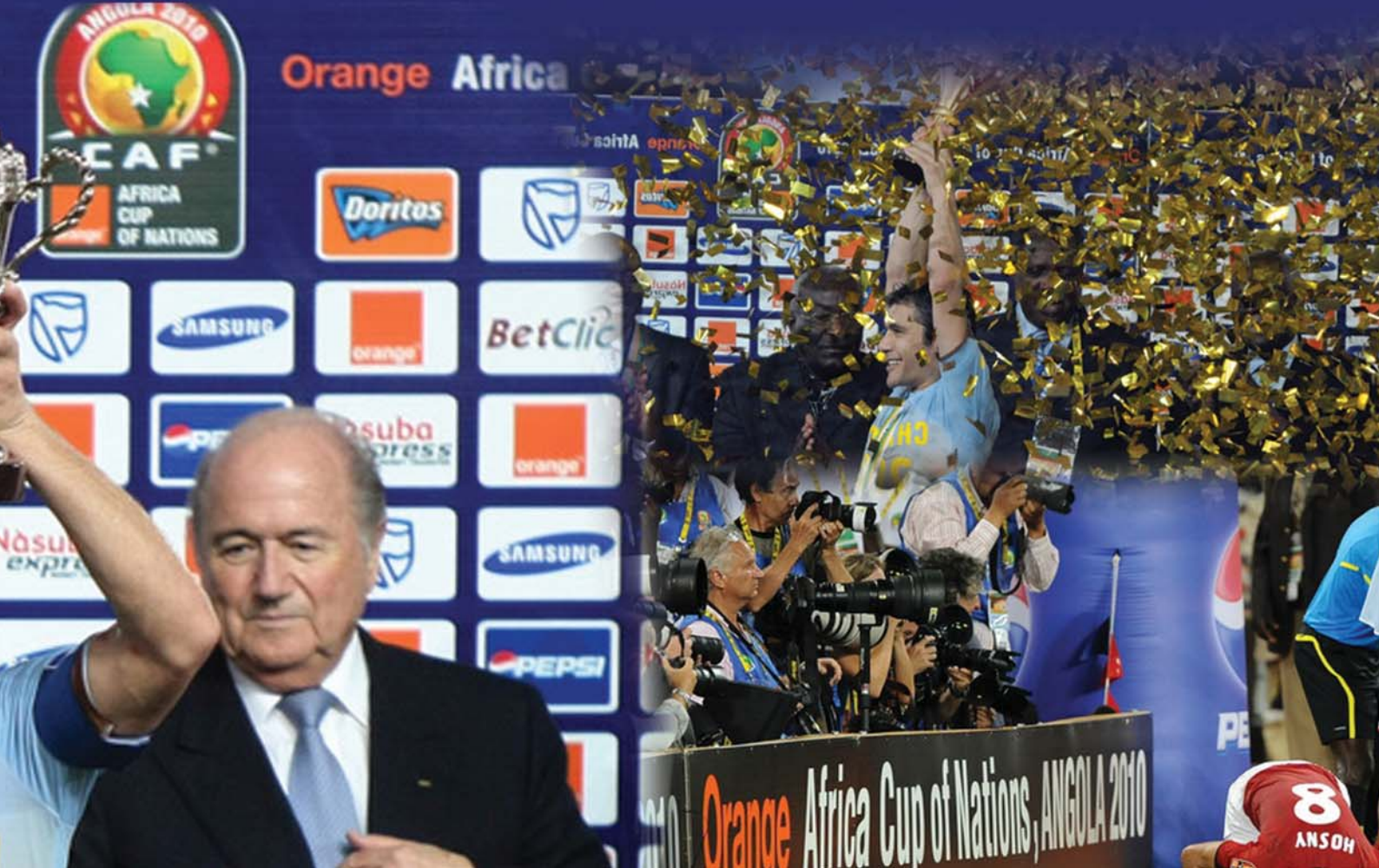
نا: ریبین ره مزى

هه مندی رابردوو له ولاتی نهنگولا کزالی به پالوانییه تییه جامی نه شه وه کانی نه فریقیا هات، دواى شهوى شه پالوانییه تییه جه نین روداری تیاییدا روویدا، شه مندی خواروه شه ووه قه یه که له باری شه پالوانییه تییه. بو شه وته مین جار میسریه کان بوونه پالوانان هه لژاردی میسر، توانی بگاته لوتکه ی جامی نه شه وه کانی نه فریقیا. دواى شهوى توانی بو جارى سیه م له سهر یه کدی و بو شه وته مین جار بیته پالوانان. شه بوره دا توانی ژماره ی پوانه یی بشکینیت. چونکه تا نیستا هیچ هه لژاردیه ک سه ج جار له سهر یه کدی نه ی توانیره شه پالوانییه تییه به ده ستیانیته، هه لژاردی میسر له یاری کزالی توانی به نه جامی گولیکی یه به رامبه ر له هه لژاردی گانا بیاته وه و بیته پله ی یه کم. شایانی نامازه پیدانه، هه لژاردی میسر له ساله کانی ۱۹۵۷، ۱۹۵۹، ۱۹۸۶، ۱۹۹۴، ۲۰۰۶، ۲۰۰۸، ۲۰۱۰ توانیوه تی شه پالوانییه تییه به ده ستیانیته. به پی سهر ژمیری فیفا هه لژاردی میسر دواى به ده ستیانی شه پالوانییه تییه هاته ریزه ندی ۱۰ یه م باشتین هه لژاردی کانی جیهان، شه مهش بو یه که مجاره هه لژاردی میسر ده گاته شه پله ی. له هه مان کات ده بیته دووم هه لژاردی