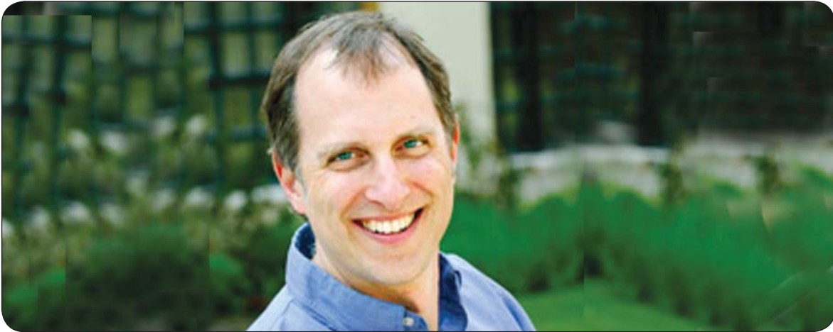
جۇن مایەر بۇ گولان:

پروفیسور جۇن مایەر ئوستادی فەلسەفەى سىياسەتە لە زانكۆى ويسكۆسن پىسپىپۇر و تايىبەتمەندە لەسەر تىۋرى سىياسى ھاۋچەرج و كۆن، بۇ قسەكردن لەسەر چەمكى فەلسەفەى سىياسەت و ئەو جىاۋازىيانەى لە نىۋان و پىناسە و پراكتىزەكردنى سىياسەت دەردەكەون، پروفىسىۋر مایەر بەمجۆرە بۇ گولان ھاتە ناخاوتن.