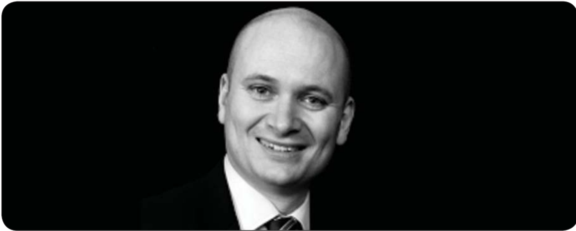
تیمۆسى لىنچ بۆ گولان:

پروفیسور تیمۆسى لىنچ بەرپۆبەرى دىراساتى سىياسەتى دەرەھى ئەمىرىكايە لە زانكۆى لەندەن و يەككە لەو شىرۆفەوانانەى سىياسەتى دەرەھى ئەمىرىكا كە رادىيۆ و تەلەفزیونەکانى ئەمىرىكاو بەرىتانىا بەردەوام پەيوەندى پتۆدەكەم، بۆقسەکردن لەسەر سىياسەتى ئەمىرىكا لەعیراق وئاینەدى سىياسىي عیراق پروفیسور لىنچ بەمجۆرە راي خۆى بۆ گولان دەرپرى.