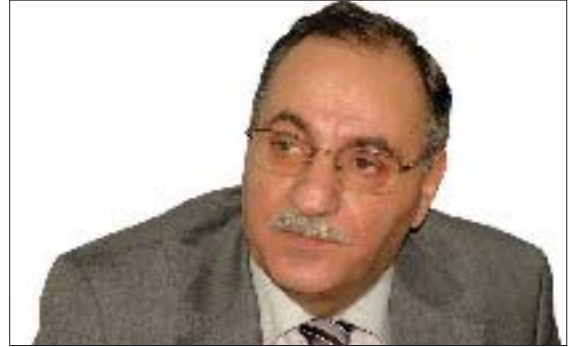
سامى شۆرش تایبەت بۆ گولان دەینوسى

سیاسى و خەلکی سەر بە پێکھاتەى سوننەى عەرەبى گرتیبۆ، بەلام لە تەك ئەوانەدا، هێزو خەلکانى شیعوو کوردیشى تێدا بوو. هەرۆه‌ها بریارەکان هەللایه‌كى زۆریشیان نایه‌وه چ لەسەر ئاستى ناوه‌خۆو چ لەسەر ئاستى ناستى نیوده‌لەتیدا.