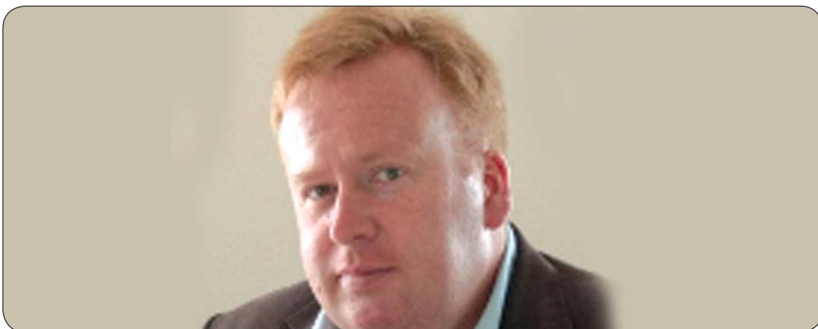
مارک پاسیان بۆ گولان:

پروفیسور مارک پاسیان ئوستادی زانستی سیاسەتە لە زانکۆی لیفەربول لەبەریتانیا و پسرۆر تاییبەتمەندە لەسەر ئاسایشی جیھانی و لەماوەی شەڕی ۸سالەیی تیران و عیراق لە ھەشتاکانی سەدەیی رابردوو پروفیسور پاسیان دیراسەتەکانی لەسەر چۆنیەتی پێدانی چەك بوو لەلایەن رۆژئاووە بەعیراق، بۆیە پروفیسور پاسیان نزیکی ۳۰ سالە چاودێری باردۆخی عیراق سەبارەت بە باردۆخی ئیستای عیراق مارک پاسیان بەمجۆرە بۆ گولان ھاتە ناخوتن.