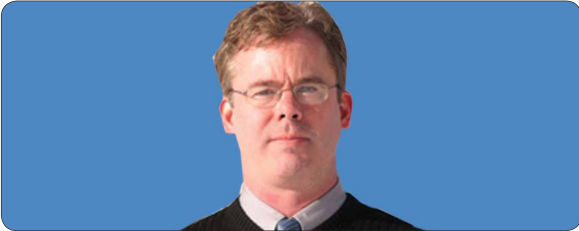
سٹیفن فاندہرہایدن بو گولان:

پروفیسور سٹیفن فاندہرہایدن نوستادی فہلسفہ و زانستی سیاستہ لہ زانکزی کولارادو و تاییہتمہندہ لہسہر تیوری سیاست و چہمکی فہلسفہ فی سیاست، بو قسہکردن لہسہر پیادہکردنی سیاست وک خیری گشتی و پاراستنی بہرژہوہندی گشتی، پروفیسور فاندہرہایدن بہمجورہ بو گولان ہاتہ ناخوتن۔